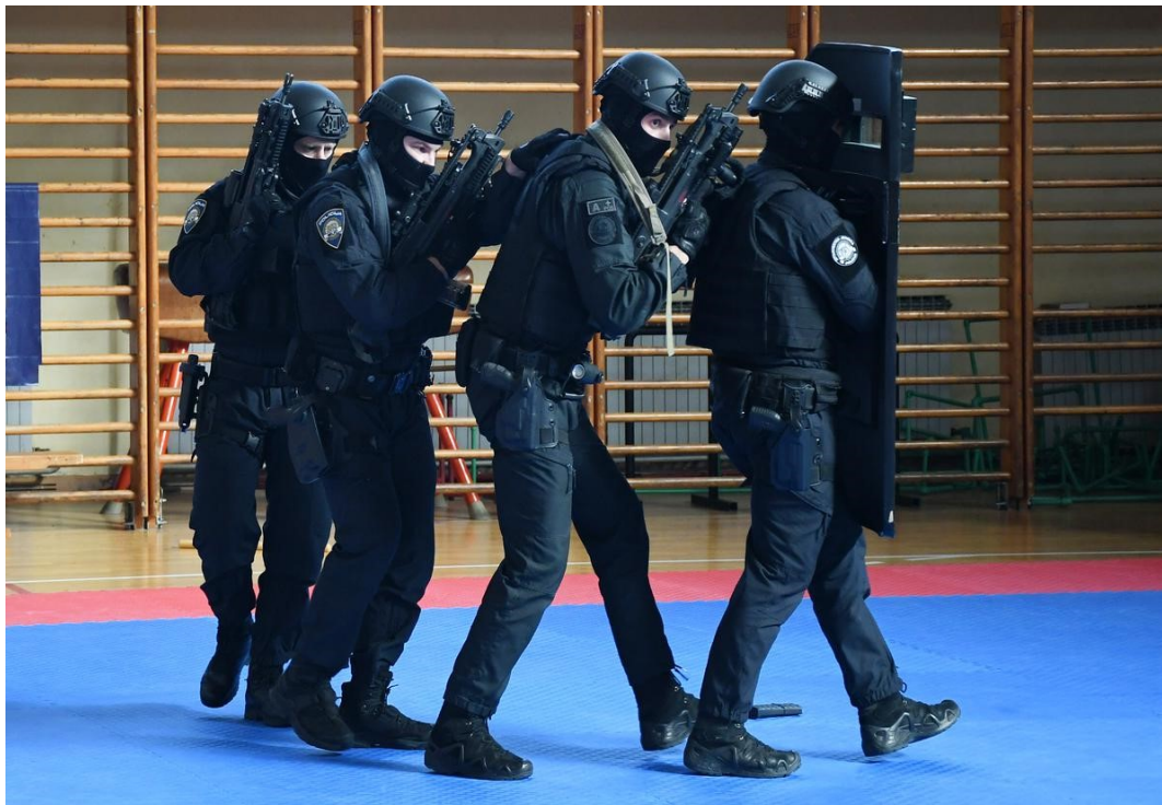
Slika 10. Korištenje balističkog štita razine III prilikom prilaska objektu

slabijih puščanih zrna provjereno zaustavlja i pruža zaštitu od puščanih zrna velike brzine kalibra do 7,62 mm.