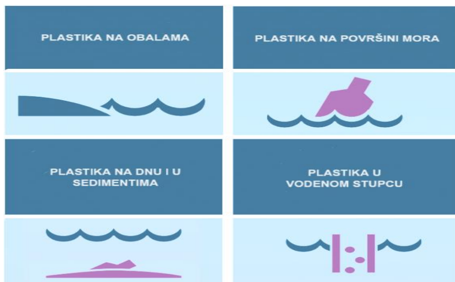
Slika 2. Plastika u svim dijelovima mora [10]

Kada otpad stigne u more, većina brzo potone na dno mora i skuplja se u obližnjim priobalnim područjima. Nešto od otpada ostaje plutati na površini mora dulje vrijeme te se može proširiti daleko od mjesta nastanka. Jedan dio pluta u vodenom stupcu (vertikalni dio mora između dna i površine), a dio se nakuplja na samoj obali (slika 2). S vremenom, plutajući otpad polako tone na dno mora gdje se sakuplja u specifičnim područjima, kao što su morski plovni putevi. Otpad koji završi na morskome dnu može tamo ostati neotkriven i nedostupan ljudima dugo vremena [6].