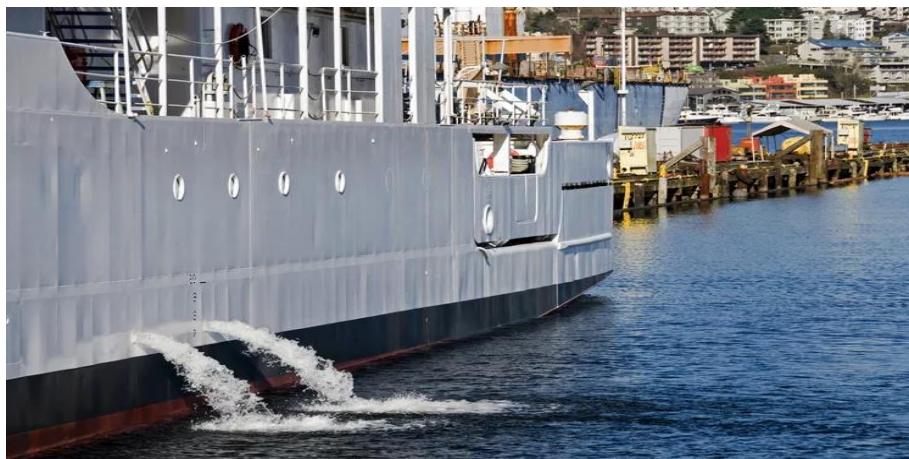
Slika 9. Ispuštanje balastne vode [32]

Balastna voda je voda koja se unosi u brod kako bi se kontrolirali trim, nagib, gaz, stabilnost i naprezanje broskog trupa, a sadrži razne tvari. U prošlosti brodovi su za balast koristili materijale poput kamena, drva i pijeska, ali od kasnog 19. stoljeća primjenjuje se voda kao balast. Kada brod istovari svoj teret, uzima balastnu vodu, a kada utovari teret, balast se ispušta (slika 9). S razvojem globalnog pomorskog prometa, ove radnje se često odvijaju u različitim ekosustavima, što dovodi do problema s balastnim vodama. Zbog intenziviranja trgovine i pomorskog prometa, broj organizama koji se prenose globalno brodskim balastnim vodama u samo mjesec dana nadmašuje onaj koji se prije prenosio tijekom cijelog stoljeća. Svaki dan se u balastnim vodama širom svijeta transportira oko 7 500 različitih vrsta (4 500 različitih vrsta organizama i 3 000 vrsta planktona), a godišnje se prenese oko 10 - 12 milijardi tona tih voda. Utjecaj na svjetsku ekonomiju procjenjuje se na oko 10 milijardi eura godišnje [2, 31].