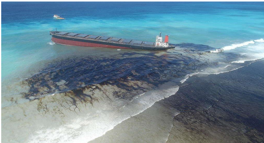
Slika 4. Izlivanje nafte iz tankera [19]

U prošlosti, nesreće na naftnim tankerskim brodovima dominirale su medijskim prikazima izljeva nafte i činile su značajan dio ljudskog doprinosa izlivanju nafte iz morskih aktivnosti. Primjer takve nesreće može se vidjeti na slici 4. Broj takvih nesreća značajno se smanjio od 1970-ih godina, a količina istjecanja nafte još više. Iako tankerske nesreće s izlivanjima nafte ne čine najveći izvor onečišćenja mora, one predstavljaju katastrofu za područja u kojima se dogode, posebno ako se radi o zatvorenim ili poluzatvorenim morima. Takvi neželjeni incidenti uzrokuju ogromnu ekološku i ekonomsku štetu, stoga se danas veća pažnja posvećuje sigurnosti pri prijevozu nafte tankerima i prevenciji mogućih ekoloških katastrofa. Moderna tankerska plovila imaju dvostruke oplata, što smanjuje rizik od izljeva nafte nakon manjih udara. Tankeri su također podijeljeni u sekcije, što znači da u slučaju curenja, cijeli teret nije izgubljen. Najvažnije je korištenje GPS-a (Globalni sustav za pozicioniranje) koje omogućuje čak i najneiskusnijem kapetanu da vidi gdje se brod nalazi u svakom trenutku. Međutim, nesreće nisu jedini način na koji tankeri ispuštaju naftu u morski okoliš i nisu čak ni najvažniji kada je riječ o količinama ispuštene nafte. Operativna istjecanja, uključujući pranje tankova morskom vodom, sadržaj nafte u balastnoj vodi i izlivanje mulja od goriva, ispuštala su više nafte od nesreća još tijekom 1970-ih godina [14, 18].