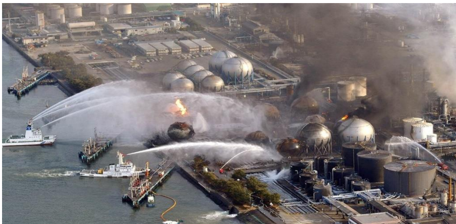
Slika 13. Nuklearna nesreća u Fukushima [42]