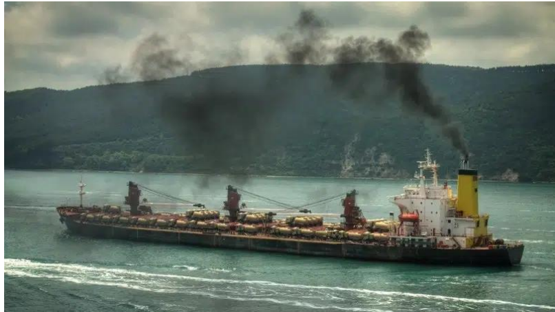
Slika 15. Onečišćenje zraka s brodova [48]

Glavni onečišćivači iz dizelskih motora, kao i iz drugih vrsta motora s unutarnjim izgaranjem su [47]: