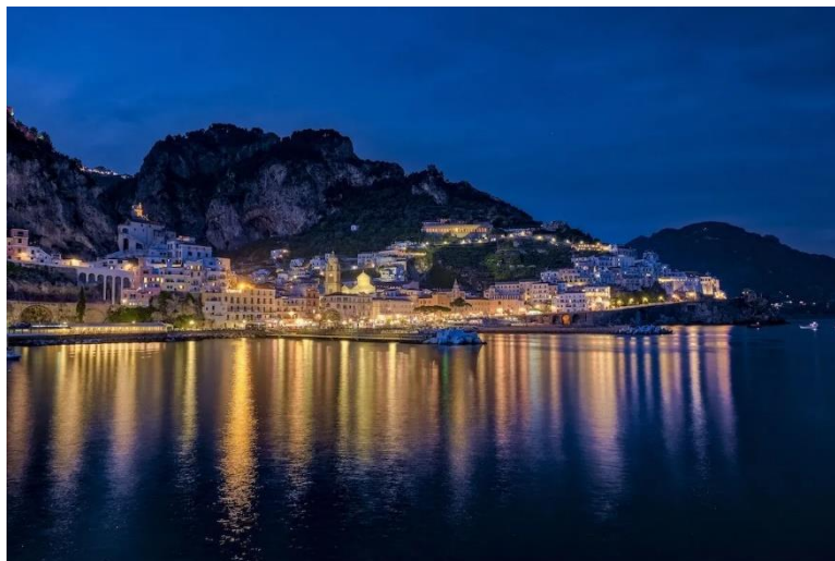
Slika 14. Prikaz obalnog grada i njegovog umjetnog osvjetljenja [45]

Prema Zakonu o zaštiti okoliša [43] svjetlosno onečišćenje je promjena razine prirodne svjetlosti u noćnim uvjetima uzrokovana unošenjem svjetlosti proizvedene ljudskim djelovanjem. Svjetlosno onečišćenje odnosi se na prekomjerno ili ometajuće umjetno svjetlo koje, poput ostalih oblika zagađenja, može poremetiti ekosustave i štetno utjecati na zdravlje. Većina živih bića osjetljiva je na promjene u kvaliteti i jačini prirodnog svjetla u svom okruženju, što ukazuje na mogućnost da je ta karakteristika nastala u ranoj fazi evolucije. Ovo bi moglo značiti da se evolucija života u morima većinom odvijala u svjetlosnoj zoni. Za alge i morske trave, fotosinteza je direktno ovisna o svjetlu, dok morske životinje iskazuju ritmičke promjene u ponašanju i fiziologiji usklađene s prirodnim svjetlosnim ciklusima. Nakon dokaza o utjecaju na ponašanje ptica, šišmiša i insekata, raste zabrinutost da bi svjetlosno zagađenje moglo štetno utjecati na vodene organizme u jezerima, rijekama i morima, naročito u obalnim područjima. Svjetlosno zagađenje može utjecati na sve organizme s optičkim sustavom orijentacije. Istraživanja pokazuju da umjetno svjetlo utječe na ponašanje, reprodukciju i opstanak morskih beskralježnjaka, amfibija, riba i ptica. Svjetlosno onečišćenje (slika 14) utječe na životinje kroz promjene u orijentaciji, privlačenjem ili odbijanjem od izmijenjenih svjetlosnih uvjeta. [43,44]