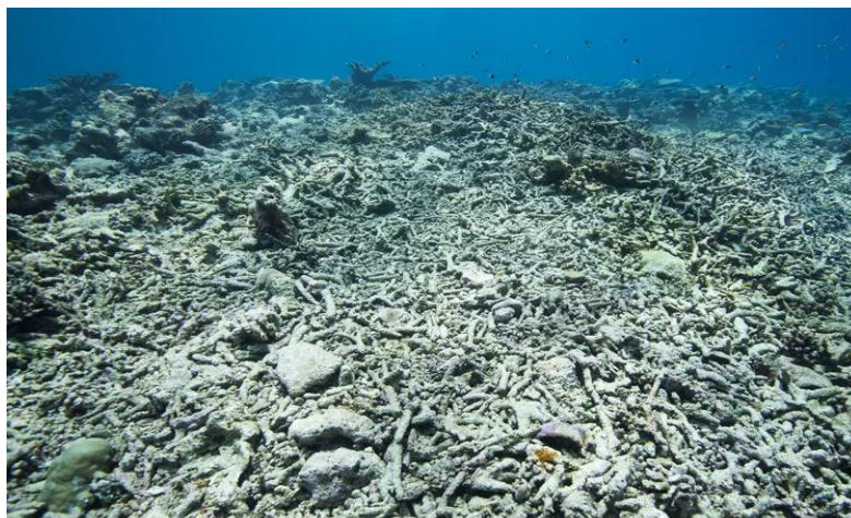
Slika 7. Morsko dno u mrtvoj zoni [27]

U mnogim područjima hipoksija je toliko ozbiljna da se ta područja nazivaju "mrtve zone" jer ništa (osim bakterija) ne može živjeti tamo. Kada razina otopljenog kisika padne ispod 0,5 mg/l, dolazi do masovnog uginuća organizama. Globalno je prijavljen porast broja mrtvih zona, kao rezultat otjecanja i taloženja dušika iz izgaranja fosilnih goriva. Oko 150 mrtvih zona identificirano je širom svijeta, uključujući vrlo veliku u Meksičkom zaljevu koja prima vodu iz rijeke Mississippi, koja drenira veći dio poljoprivrednog centra Sjedinjenih Američkih Država. Taj slijev obuhvaća 41% kontinentalnih SAD i sadrži velik dio poljoprivrednog zemljišta te zemlje. Ova hipoksična zona prijeti vrijednom komercijalnom i rekreacijskom ribarstvu Meksičkog zaljeva. Od 415 područja širom svijeta identificiranih kao područja koja doživljavaju neki oblik eutrofikacije, 169 je hipoksično i samo 13 se klasificira kao oporavljeno. Znanstvenici su zabilježili drastičan pad bogatstva vrsta, raznolikosti vrsta i stope ulova u uvjetima niske razine otopljenog kisika, što sugerira da ribe počinju izbjegavati područje kada razine otopljenog kisika padnu ispod otprilike 4 mg/l, jer počinju trpjeti fiziološki stres. Ovaj odgovor na ovu vrijednost je zanimljiv jer je veći od 2 mg/l koji je formalna definicija hipoksije. Slika 7 pokazuje kako izgleda morsko dno u jednoj mrtvoj zoni [2].