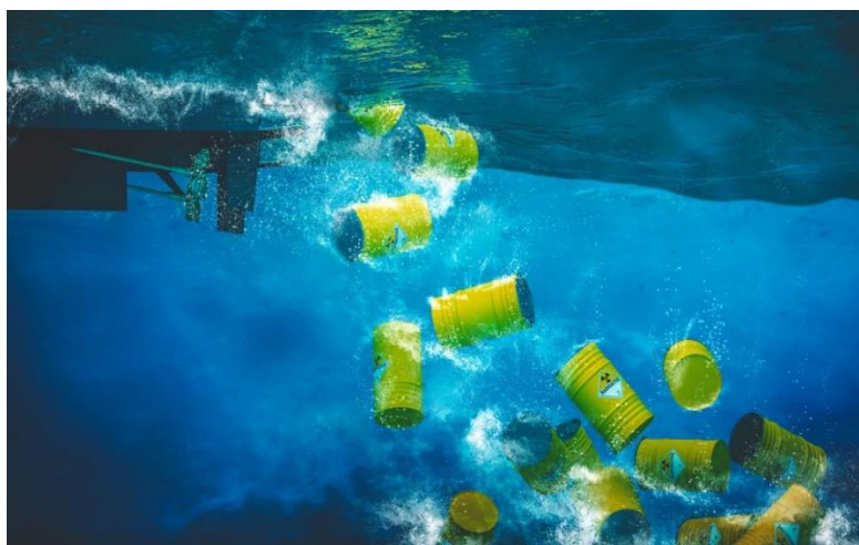
Slika 12. Odlaganje radioaktivnog otpada u more [41]

Prva operacija odlaganja radioaktivnog otpada u more dogodila se 1946. godine blizu obale Kalifornije u sjeveroistočnom dijelu Tihog oceana. Ova praksa nastavila se sve do 1993. i obuhvaćala je odlaganje tekućeg i čvrstog nuklearnog otpada, kao i nuklearnih reaktorskih posuda, s gorivom ili bez njega, u različite oceane. Tekući nuklearni otpad uglavnom se odlagao u Arktički i Tih ocean, dok se čvrsti otpad odlagao u Atlantski, Arktički i Tih ocean. U more su odlagane tri vrste radioaktivnog otpada: tekući otpad, čvrsti otpad i reaktorske posude pod tlakom, s gorivom ili bez njega. Tekući otpad odlagan je ili nezapakiran i razrijeđen na površini mora, ili u spremniku, ali nesolidificiran na morskome dnu. Čvrsti otpad uključivao je niskorazinski otpad poput papira i tekstila iz dekontaminacije, solidificiran s cementom ili bitumenom i zapakiran u metalne kontejnere, te nezapakiran čvrsti otpad poput velikih dijelova nuklearnih postrojenja. Reaktorske posude odlagane su bez goriva od strane bivšeg Sovjetskog Saveza i SAD-a, s oštećenim potrošenim gorivom od strane bivšeg Sovjetskog Saveza (obrada s furfuralom za dodatnu zaštitu), te u posebnim kontejnerima s oštećenim gorivom s ledolomca Lenjin [40]. Na slici 12 prikazano je odlaganje radioaktivnog otpada u more.