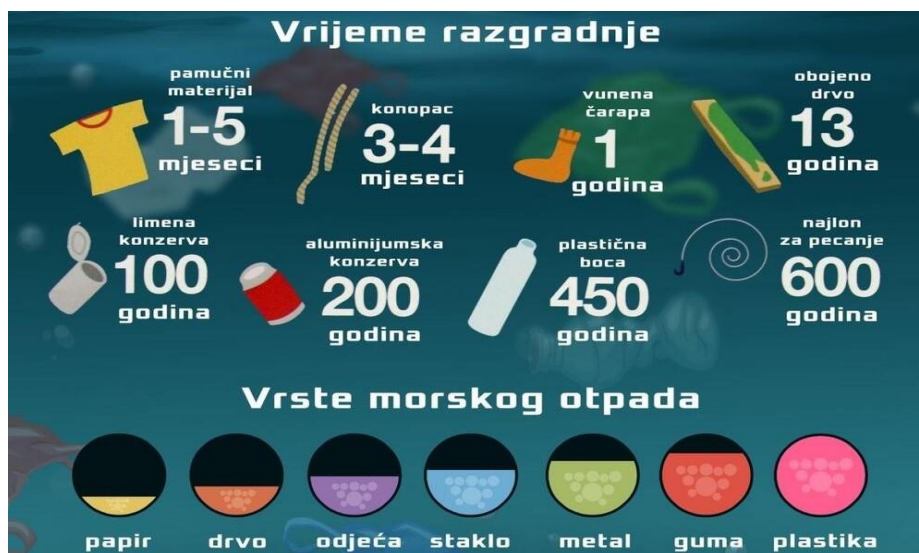
Slika 1. Vrste morskog otpada i vrijeme razgradnje nekih predmeta [6]

Otpad je pronađen u svakom kutku oceana, od najudaljenijih obala, do leda u Arktiku, pa čak i u najdubljim dijelovima morskog dna. Neki od najčešćih i najštetnijih tipova morskog otpada uključuju plastiku, poput opušaka cigareta, plastičnih vrećica i omota hrane, te odbačen ribolovni pribor. Morski otpad također može varirati u veličini, od najmanjih plastičnih komadića, tzv. mikroplastike, koji mogu biti premali da bi se vidjeli golim okom, do ogromnih napuštenih i zastarjelih plovila, građevinskog otpada i kućanskih uređaja koji mogu oštetiti osjetljiva staništa. Iako se neki od ovih predmeta s vremenom mogu razgraditi, drugi su napravljeni da traju dugo (slika 1). Jednom kada se nađu u okolišu, ti predmeti možda nikada u potpunosti ne nestanu [5].