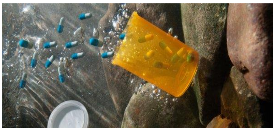
Slika 8. Farmaceutici u vodi [30]

Farmaceutski proizvodi spadaju u kategoriju novih zagađivača okoliša, koji uključuju raznolike skupine lijekova i prehrambenih dodataka upotrebljivanih u ljudskoj i veterinarskoj medicini. Prema nekim procjenama, u svijetu se u ljudskoj medicini koristi oko 4000 različitih aktivnih farmaceutskih sastojaka za različite terapijske svrhe, s godišnjom proizvodnjom koja premašuje 100 000 tona. Farmaceutski proizvodi uključuju lijekove na recept i bez recepta, poput antibiotika, kontracepcijskih pilula, sedativa, lijekova protiv bolova i drugih lijekova, dok osobni higijenski proizvodi uključuju sapune, parfeme, kreme za sunčanje i kozmetiku. Koriste se za liječenje, dijagnostiku i prevenciju bolesti kod ljudi i životinja. Njihova proizvodnja je kontinuirana, a potražnja raste. Bolnice, nepravilno odlaganje neupotrijebljenih lijekova, te farme gdje se lijekovi (posebno antibiotici) dodaju u stočnu hranu radi poticanja rasta, bolje iskoristivosti hrane, i liječenja ili prevencije bolesti, predstavljaju načine na koje farmaceutici ulaze u okoliš. Kada se stajski gnoj, koji može sadržavati antibiotike, koristi za gnojidbu, ti lijekovi se mogu prenijeti na poljoprivredno zemljište, a odatle i u podzemne vode. Također, farmaceutici mogu dospjeti u tlo gnojenjem poljoprivrednih površina aktivnim muljem, koji je proizvod obrade komunalnih otpadnih voda. Industrija farmaceutike također predstavlja izvor zagađenja površinskih (slika 8) i podzemnih voda [2, 28, 29].