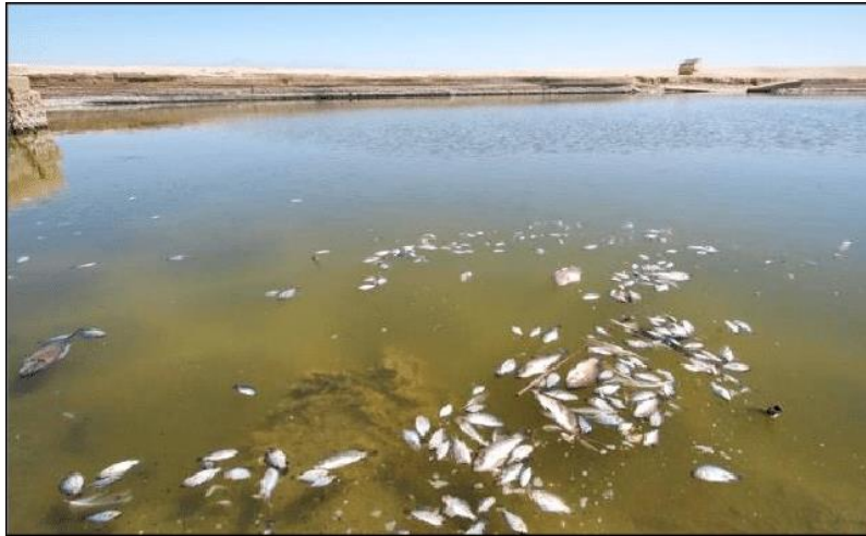
Slika 16. Utjecaj kiselih kiša na ribu [50]