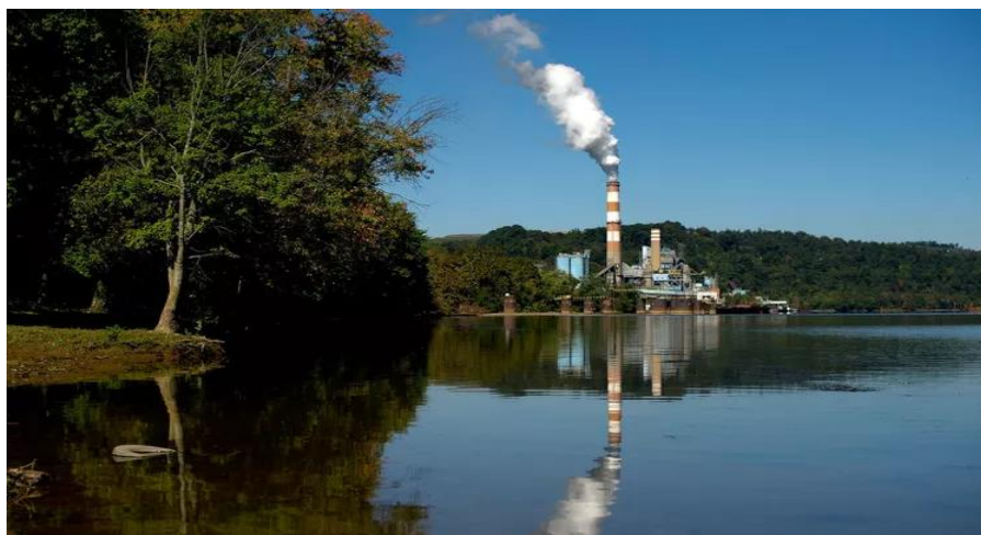
Slika 11. Primjer industrijskog postrojenja koje ispušta zagrijanu vodu [39]

Termalno onečišćenje odnosi se na bilo kakvu promjenu u temperaturi prirodnih vodenih tijela uzrokovanu ljudskim djelovanjem. Najčešći oblik ovog onečišćenja je povećanje temperature. Glavni uzročnici toplinskog onečišćenja uključuju nuklearne i termoelektrane, rafinerije nafte, čeličane, termoelektrane na ugljen i industrijske kotlove koji koriste vodu iz prirodnih tokova za hlađenje svojih uređaja, a zatim je vraćaju zagrijanu (slika 11), povećavajući temperaturu vodenih ekosustava, što dovodi do promjena u njihovim fizikalnim, kemijskim i biološkim svojstvima. Posebno istaknute među ovim izvorima su nuklearne elektrane, koje zahtijevaju znatno više hladne vode nego ostale vrste elektrana. Osim industrijskih izvora, drugi značajni faktori toplinskog onečišćenja uključuju eroziju tla, urbano otjecanje te uništavanje obalne i šumske vegetacije. Globalno zatopljenje može dodatno pojačati štetne učinke toplinskog onečišćenja na okoliš. Klimatske promjene se smatraju difuznim izvorom toplinskog onečišćenja, koje široko utječe na slatkovodna staništa. Antropogeno hlađenje slatkih voda također može imati snažne učinke na vodeni život. Ispuštanje hladne vode iz donjih slojeva velikih rezervoara utječe na temperaturne uvjete rijeka na velikim udaljenostima. Takva ispuštanja mogu značajno promijeniti uobičajene sezonske temperature, snižavajući ih za više od 10 °C [37, 38].