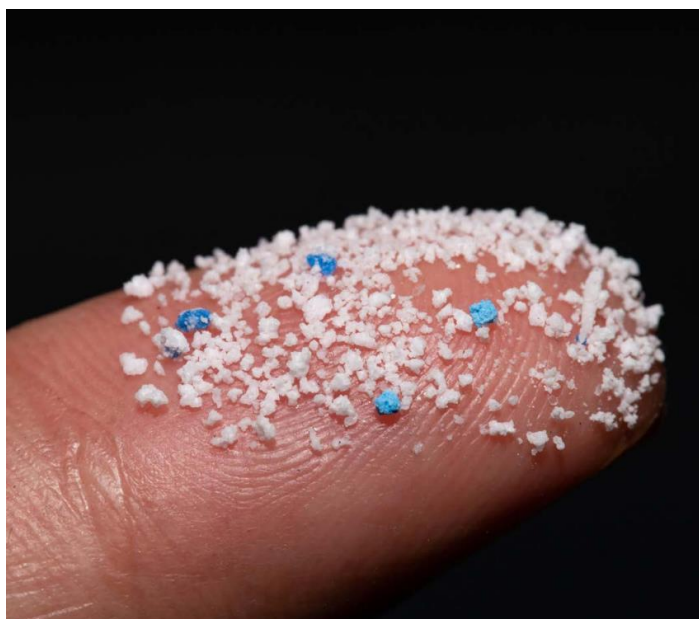
Slika 3. Mikroplastika [4]

Mikroplastika sama po sebi nije otrovna, no ako je organizam dulje vrijeme izložen mikroplastici, može doći do trovanja zbog prisutnosti aditiva u njoj, kao što su plastifikatori poput ftalata, pigmenti, stabilizatori, antioksidansi kao bisfenol A, spojevi kadmija i olova, sredstva protiv klizanja (amidi masnih kiselina), biocidi (npr. spojevi arsena) i drugi. Osim toga, gutanje mikroplastike može uzrokovati različita oštećenja zbog oštih rubova mikroplastike. Mikroplastika obično ima manju gustoću od vode i nije podložna biološkoj razgradnji, no u vodenom okolišu mikroorganizmi je naseljavaju i stvaraju sloj zvani biofilm. Ovaj nastali biofilm ima ključnu ulogu u distribuciji mikroplastike u vodi jer povećava njenu gustoću, uzrokujući da se mikroplastika s vremenom taloži na dnu vodenog tijela, gdje se sedimentira. Unatoč malom promjeru, čestice mikroplastike imaju veliku aktivnu površinu na koju se vežu razne zagađujuće tvari, što doprinosi njenom toksičnom učinku. Na površinu mikroplastike adsorbiraju se teški metali, patogeni, organske zagađujuće tvari i pesticidi. Adsorpcija ovih zagađujućih tvari na mikroplastiku ovisi o raznim čimbenicima, uključujući starost mikroplastike, blizinu zagađujućih tvari, vrstu mikroplastike i njenu molekularnu strukturu, polarnost mikroplastike, omjer površine i volumena mikroplastike te uvjete u okolišu. S obzirom na navedena svojstva, mikroplastika predstavlja značajnu prijetnju okolišu i živim organizmima [13].