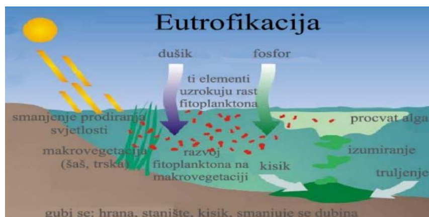
Slika 6. Eutrofikacija [26]

Globalni porast eutrofikacije posljedica je povećanja intenzivne poljoprivrede, industrijskih aktivnosti i ljudske populacije. Eutrofikacija (slika 6) je proces prekomjernog obogaćenja hranjivim tvarima u morskim vodama, a koji potiče pretjerani rast algi. Proces eutrofikacije može posljedično smanjiti sadržaj otopljenog kisika, ugušiti ribe i druge vodene organizme, smanjiti prozirnost vode, smanjiti ukupnu kvalitetu vode i narušiti ekološku ravnotežu. Neke alge čak mogu proizvesti toksine koji su štetni za stoku i ljudsko zdravlje. Mala povećanja algi mogu povećati produktivnost u prehrambenim lancima i održavati više ribe i školjkaša. Međutim, prekomjerno poticanje rasta algi može ozbiljno narušiti kvalitetu vode i ugroziti živi svijet. Kada cvjetanje algi na kraju zamre, mrtve stanice tonu na dno, gdje potiču bakterije na njihovu razgradnju. Proces razgradnje troši otopljeni kisik iz vode. Ako je aeracija vode miješanjem manja od kisika koji se troši bakterijskim metabolizmom, donje vode će postati hipoksične (s niskim sadržajem kisika) ili anoksične (bez kisika), stvarajući stresne ili smrtonosne uvjete za stanovnike dna. Hipoksija je veliki problem u mnogim estuarijima, posebno krajem ljeta i početkom jeseni, i globalno je u porastu [2].