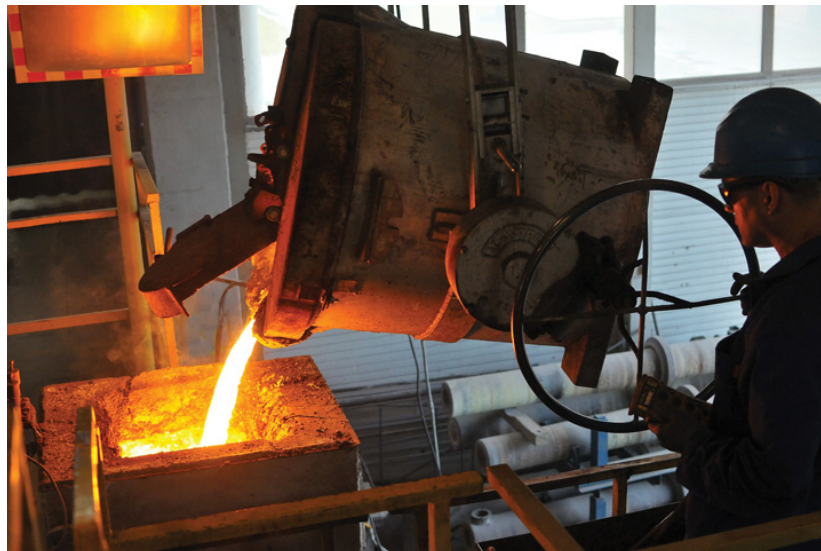
Lijevanje tekućega željeza u ljevački lonac u čakovečkom poduzeću Ferro Preis, 2015.

Pojava željeza i razvoj tehnologije dobivanja željeznih materijala Pojava i proizvodnja željeza u Hrvatskoj Prapovijest i antičko doba Do početka II. svj. rata Razvoj željezne industrije i suvremena proizvodnja željeznih materijala u Hrvatskoj željezo