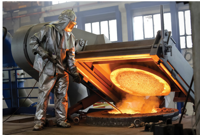
Radnik na peći za taljenje metala u čakovečkom poduzeću Ferro-Preis, 2015.

Bjelovaru → TOMO VINKOVIĆ 1919., Prva jugoslavenska tvornica vagona, strojeva i mostova Brod na Savi (→ ĐURO ĐAKOVIĆ GRUPA; sv. 1) 1921. u Slavonskom Brodu, ljevaonica željeza i tvornica strojeva Dragutin Fleissig Požega (→ PLAMEN; sv. 1) 1922., ljevaonica metala i tvornica strojeva → DALIT (sv. 1) 1938. u Daruvaru, tvornica alatnih strojeva → PRVOMAJSKA (sv. 1) 1946. u Zagrebu, tvornica strojeva i čeličnih konstrukcija → METALAC (sv. 1) 1949. u Čakovcu (danas → FERRO-PREIS; sv. 1), tvornica strojeva i ljevaonica → METAL (sv. 1) 1949. u Hercegovcu, ljevaonica i tvornica kotlovske opreme → METALAC (sv. 1) 1961. u Konjščini i dr. Također, pojačana brodograđevna djelatnost (→ BRODOGRADNJA; sv. 1) u hrvatskim brodogradilištima utjecala je na potrebe povećanja metalurške djelatnosti.