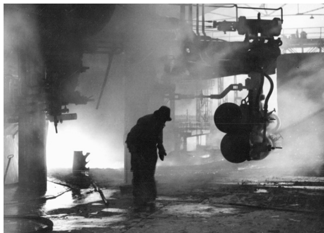
Ljevač na visokoj peći, Željezara Sisak, druga polovica XX. st.

međuproizvoda. Proizvodnjom sirova željeza postiže se bolje odvajanje metala od troske, ali se istodobno iz rude u sirovo željezo reduciraju prateći elementi. Izravni redukcijski procesi osiguravaju manji udio neželjenih primjesa u željezu.