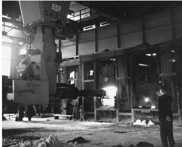
Ulaganje uložaka u Siemens-Martinove (SM) peći, Željezara Sisak, druga polovica XX. st.