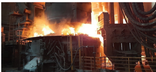
Ulaganje pripremljenoga starog željeza u elektrolučnu peć, ABS Sisak, 2021.

Od željeznih slitina važne su i ferolegure. One uz željezo sadržavaju i velik, često i pretežan udio drugih metala. Od njih se ne izrađuju konačni proizvodi, nego služe za dodavanje drugih elemenata u taline čelika i lijevanoga željeza radi legiranja, te za uklanjanje nepoželjnih sastojaka iz talina. Važnu uporabu pronalaze spojevi željeza poput ferocena kao katalizatora, te ferita, prikladnog za primjenu u tehnici visokih frekvencija, kao magnetskog materijala za memorije elektroničkih računala, za jezgre električnih zavojnica, visokofrekventnih transformatora i magnetskih antena (tzv. feritnih antena).