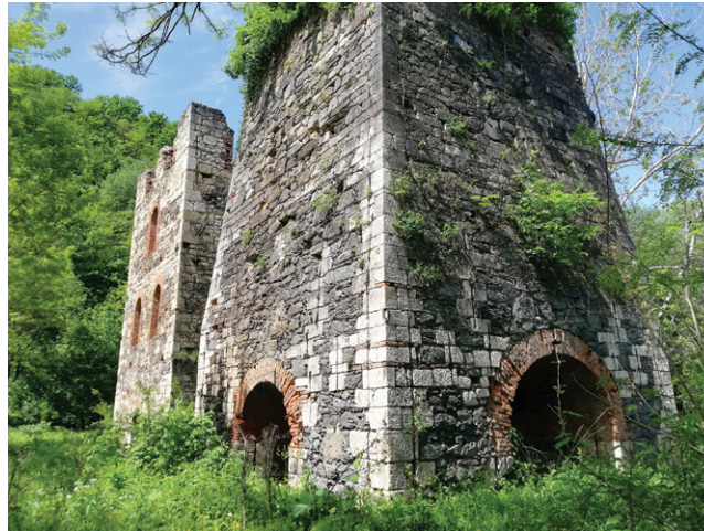
Visoke peći Bešlinec

Nakon I. svj. rata nastavilo se vaditi željeznu rudu na Trgovskoj gori. Prema statističkim podacima rudarstva Kraljevine Jugoslavije, ukupna proizvodnja željeza u talionicama Topusko (Vranovina) i Bešlinac u razdoblju 1919–37. iznosila je 1000–10 000 t na godinu, a zaposlenika je bilo 149. Godine 1941. Bešlinac je kupilo poduzeće Bata (→ BOROVO). Najviše su se proizvodili čavli, potkovice i zakovice za cipele, a još je prve godine ljevaonica proizvodila dijelove za bicikle, pribor za jelo i odljevke od sivoga lijeva.