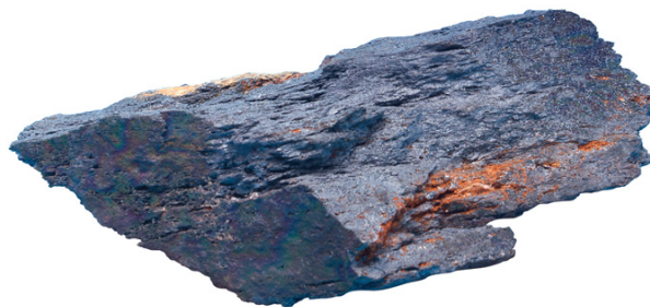
Hematit, Mineraloška zbirka Metalurškoga fakulteta u Sisku

željezo , najrašireniji metal u rudama Zemljine kore, srebrnobijele boje, razmjerno mekan i kovan, te kemijski otporan; kemijski element atomskoga broja 26, gustoće 7,87 \text{ g/cm}^3 , Mohsove tvrdoće 4, tališta 1538 \text{ °C} i vrelišta 2862 \text{ °C} . Željezo vezano u spojevima prisutno je u približno 400 minerala, od kojih su najpoznatiji hematit (udjel željeza do 69,94%), magnetit (do 72,36%), limonit (59,23–65,53%), pirotin i pirit (59,23–65,53%), siderit (do 48,2%). Neizostavno je u proizvodnji različitih slitina velike čvrstoće, tvrdoće, žilavosti, mogućnosti lijevanja i mehaničke obradbe. Najvažniji tehnološki i konstrukcijski materijal današnjice, → ČELIK, slitina je željeza s najviše 2% ugljika.