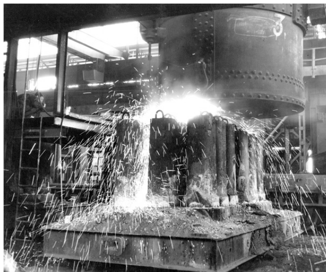
Lijevanje čelika iz velikog lonca u kalupe, Željezara Sisak, druga polovica XX. st.

Do Domovinskoga rata proizvodnja čelika s preradbom iznosila je približno 450 000 t čelika na godinu. Sukladno tomu, metalna je industrija SRH 1985. obradila ukupno 409 200 t čeličnih proizvoda, 35 500 t ljevaoničkoga koksa, 73 000 t sirova željeza, 19 800 t starog željeza. Osim sisačke željezare, Hrvatska je imala i drugih metalurških poduzeća koja su proizvodila materijale na bazi željeza. Ističu se → ŽELJEZARA SPLIT, → TVORNICA ELEKTRODA I FEROLEGURA iz Šibenika, → TVORNICA KARBIDA I FEROLEGURA DALMACIJA – DUGI RAT iz Dugog Rata, → ARMKO iz Konjščine, Valjaonica Kumrovec, Histria tube iz Potpićana u Istri i dr. Danas se proizvodnja željeza u RH znatno smanjila, Godine 2019. proizvodnja čelika iznosila je 68 000 t, dok je 2020. pala na 47 000 t.