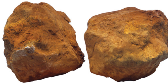
Limonit, Mineraloška zbirka Metalurškoga fakulteta u Sisku

Kemijski čisto željezo proizvodi se rijetko zbog umanjenih fizikalnih i mehaničkih svojstava te složenijih i skupljih proizvodnih postupaka u odnosu na čelik, ali i zbog uporabe ograničene samo na područje metalurgije praha, katalizu te proizvodnju specijalnih magneta.