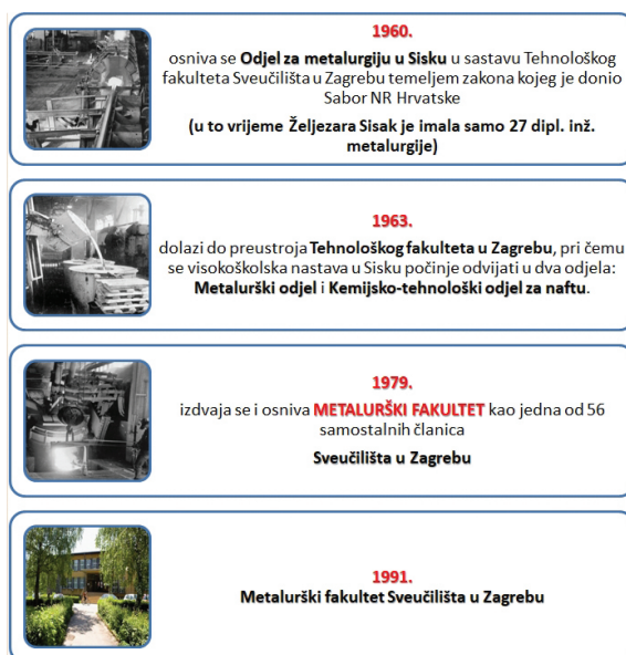
Slika 2 – Razvoj nastavne djelatnosti i polja metalurgija i Metalurškog fakulteta 2-4