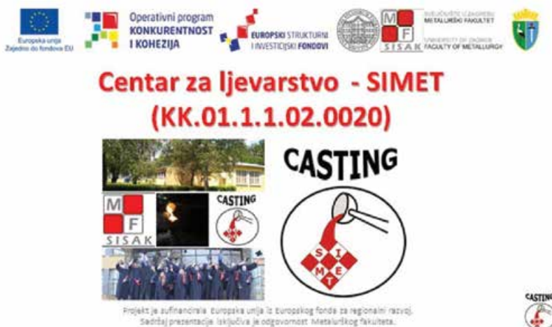
Slika 4: Predstavljanje i vizualne oznake projekta Centra za ljevarstvo - SIMET

Metalurška proizvodnja smatra se jednim od glavnih čimbenika koji utječe na razvoj svjetske ekonomije. U svijetu je ona profitabilna dok je u Republici Hrvatskoj identificiran niz problema, među kojima su loše poslovno okruženje, nedostatak investicija te loša komunikacija između malih i srednjih poduzetnika iz područja metalne industrije, znanstvenih institucija, visokih učilišta te lokalnih i regionalnih vlasti. Projekt Centra za ljevarstvo – SIMET je prilika za promijeniti okolnosti. Uvažavajući teorijska znanja, metalurška struka snažno se oslanja na gospodarstvo u međusobnoj razmjeni znanja i iskustva. U okviru Centra za ljevarstvo – SIMET, predviđene aktivnosti istraživanja i razvoja, uz ostale aktivnosti povezane s uvođenjem inovacija u poduzeća, neophodne su za pozicioniranje, prepoznatljivost izvrsnosti Metalurškog fakulteta, prepoznatljivost i vidljivost Sveučilišta u Zagrebu, povratak Siska i Sisačko-moslavačke županije u status centra atraktivne znanstvene izvrsnosti, procesnih znanja i kompetencija te niše za razvoj gospodarstva Republike Hrvatske.