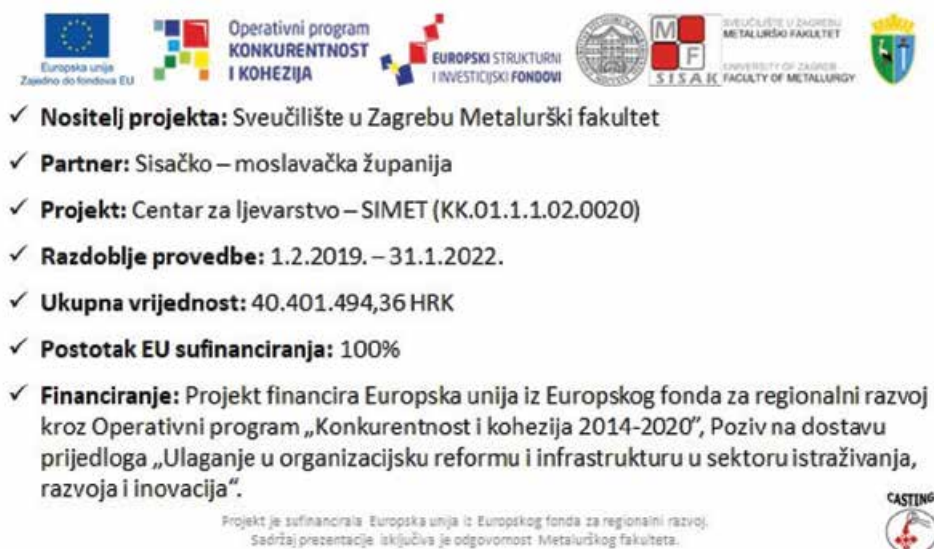
Slika 2: Opće informacije o projektu Centar za ljevarstvo - SIMET

Suočeni sa sve nižom stopom ulaganja u istraživanja i razvoja u bruto društvenom proizvodu (BDP-u) Republike Hrvatske u usporedbi sa srednjom vrijednošću udjela u Europskoj uniji, prepoznavanje ove projektne ideje uvrštavanjem na indikativnu listu projekata te implementacija projekta Centar za ljevarstvo - SIMET kroz projekt u okviru Priprema zalihe infrastrukturnih projekata za Europski fond za regionalni razvoj 2007.-2013. te konačnu implementaciju projekta kroz Europski fond za regionalni razvoj, Operativni program Konkurentnost i kohezija 2014.-2020. u okviru poziva „Ulaganje u organizacijsku reformu i infrastrukturu u sektoru istraživanja, razvoja i inovacija“ predstavlja direktnu potporu hrvatskom obrazovnom sustavu s naglaskom na visokoškolsko obrazovanje i gospodarstvu s općim informacijama o provedbi prikazanim na slici 1.