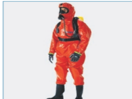
Slika 3. Osobna zaštitna oprema [47]