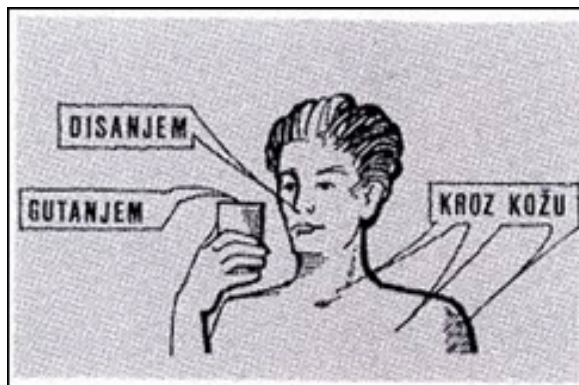
Slika 2. Načini ulaska kemijskih supstanci u organizam [32]