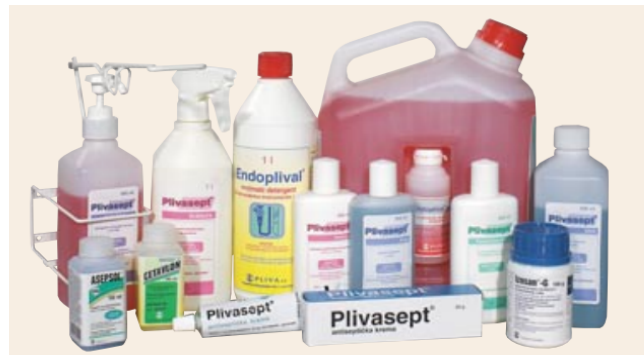
Slika 1. Dezinficijensi [4]

je presudna. Koncentracija, način primjene, vrijeme izlaganja i potrebne mjere sigurnosti moraju biti dosljedno poštovane kako bi se izbjegla potencijalna neprikladna izlaganja. Posebno je važno zaštititi kožu, sluznice i dišne puteve od moguće iritacije ili ozljeda. Također, osvješćivanje zdravstvenih radnika o važnosti osobne zaštitne opreme ključno je za minimiziranje rizika. Korištenje rukavica, maski, naočala i zaštitnih odijela pomaže u smanjenju izloženosti dezinficijensima i antisepticima te štiti radnike od mogućih iritacija ili alergijskih reakcija. S obzirom na sveprisutnu potrebu za dezinfekcijom i održavanjem čistoće u zdravstvenim ustanovama, kontinuirano educiranje o pravilnoj uporabi dezinficijensa i antiseptika postaje neophodno. Radnici moraju biti svjesni specifičnosti svake vrste supstanci i primjene, kako bi mogli osigurati najviši standard higijene uz minimalni rizik za svoje zdravlje. U kontekstu promjenjivih izazova i novih infektivnih prijetnji, razvoj inovativnih metoda dezinfekcije koje smanjuju potrebu za izlaganjem štetnim kemikalijama postaje sve važniji. Kombiniranje tradicionalnih i alternativnih pristupa može osigurati optimalnu ravnotežu između sigurnosti i efikasnosti u osiguravanju higijene u zdravstvenim ustanovama [3].