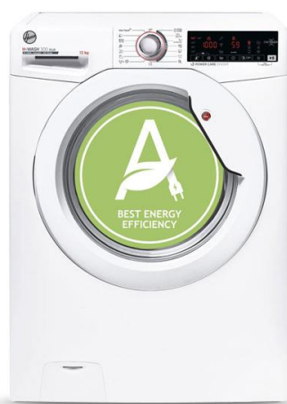
Slika 3. Primjer stroja za pranje rublja koji je proizveden na ekološki način (21)

Štednja vode jednako je važna kao i štednja energije. Kao rezultat toga, dizajneri bi trebali težiti stvaranju kućanskih aparata itd. koji troše znatno manje vode (20). Na slici 3. prikazan je proizvod namjenjen za smanjenje zagađenosti vode, smanjenje potrošnje, uz uštedu novca, energije i manju štetnost okoliša jer smanjuje emisiju ugljičnog dioksida i drugih stakleničkih plinova (21).