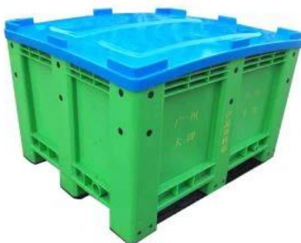
Slika 6. Višekratni plastični proizvodi za prehrambenu industriju (25)

Ponovna uporaba je druga faza i u njoj je potrebno uspostaviti učinkovit sustav povrata koji iskorištava prednosti postojećih mreža i minimizira potrebu za prijevozom, koristiti prijenosne pakete za ponovno punjenje kako bi se omogućila ponovna upotrebu boca u domu, te način posuđivanja paketa kupcima umjesto da ih se proda (19,25). Na slici 6 prikazan je višekratni plastični proizvod koji se koristi u prehrambenoj industriji.