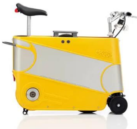
Slika 1. Sklopivi bicikl (11)