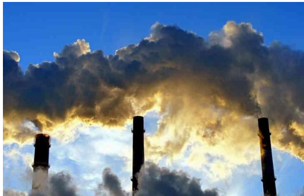
Slika 4. Zagađenje zraka koje može pojačati globalno zatopljenje (23)

Drugi značajan problem za okoliš je gubitak ozonskog omotača u stratosferi. Više će UV zraka doći do Zemljine površine ako se ozonski omotač stanji, uzrokujući štetu živim bićima, kao što je rak kože kod ljudi. Ozon se inače razgrađuje UV zračenjem, ali prisutnost klora, koji oštećuje molekule ozona, ubrzava proces (19). Na slici 4 prikazano je zagađenje zraka (23).