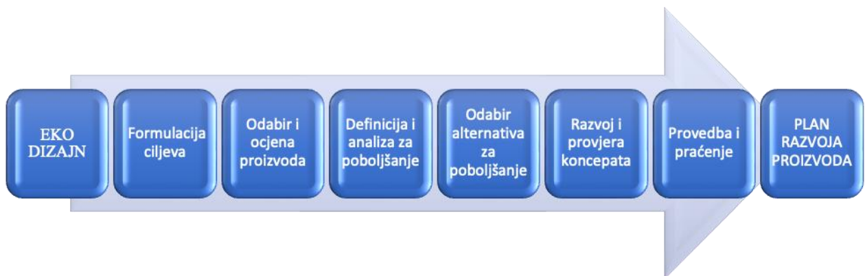
Slika 2. Koraci pri primjeni eko dizajna (16)

veliki naglasak koji se daje ekološkim čimbenicima kroz dizajn proizvoda i razvoj estetike proizvoda. Okoliš je moralno, ali i praktično pitanje. Zbog toga se mnogi ljudi slažu da dizajneri trebaju težiti smanjenju utjecaja svog rada na okoliš (15). Međutim, brojni dizajneri i škole dizajna i dalje zanemaruju pitanja zaštite okoliša; usprkos tome, informacije o ekološkim izazovima i njihovoj važnosti za proces projektiranja moraju biti uključene u temeljni kurikulum. Dizajneri moraju shvatiti područja koja se protežu daleko izvan granica standardnog obrazovanja o dizajnu kako bi predvidjeli izazove i stvorili inventivna rješenja (13). Zajedno s računalnim programiranjem i marketingom, znanosti o životu i ponašanju, ekologija i antropologija mogu postati potrebne komponente za dizajn. Dizajneri imaju mogućnost ostvariti značajan utjecaj ako tako odluče. Taj će učinak, međutim, zahtijevati znanje, otvorenost i fleksibilnost, kao i sposobnost nastavka učenja (15). Tehnika zelenog dizajna može se raščlaniti na šest glavnih komponenti (slika 2) (16).