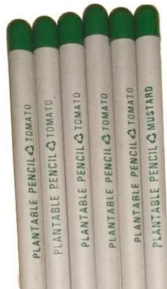
Slika 7. Prirodne reciklirane olovke sa sjemenom (27)

U trećoj fazi (recikliranje), mora se koristiti jedan kompatibilni materijal za pojednostavljenje recikliranja, materijale koji se mogu reciklirati i one materijale s postojećim sustavom prikupljanja i recikliranja, kloniti se laminata koji se ne mogu reciklirati i folija od više vrsta materijala, svakako izbjegavati korištenje naljepnica, ljepila, premaza i završnih slojeva koji mogu kontaminirati recikliranje, osigurati da se tinte mogu reciklirati i da potrošač razumije mogućnost recikliranja proizvoda (9,17). Na slici 7 prikazane su reciklirane olovke sa sjemenom.