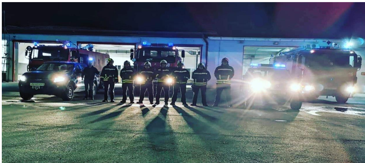
Slika 16. Profesionalni vatrogasci u gospodarstvu

Vatrogasci u rafineriji nafte Sisak moraju biti dostatne fizičke spreme za obavljanje vatrogasnog zanimanja. Fizička sprema se provjerava svakih šest mjeseci, to jest dva puta unutar godinu dana. Vatrogasci u gospodarstvu imaju svakih godinu dana i specijalistički liječnički pregled te svake dvije godine i psihološki pregled. Vatrogasci rafinerije nafte Sisak imaju beneficirani radni staž.