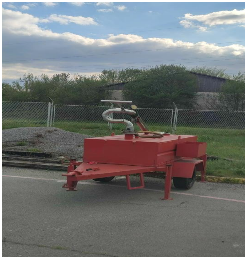
Slika 10. Mobilni bacač voda/pjena