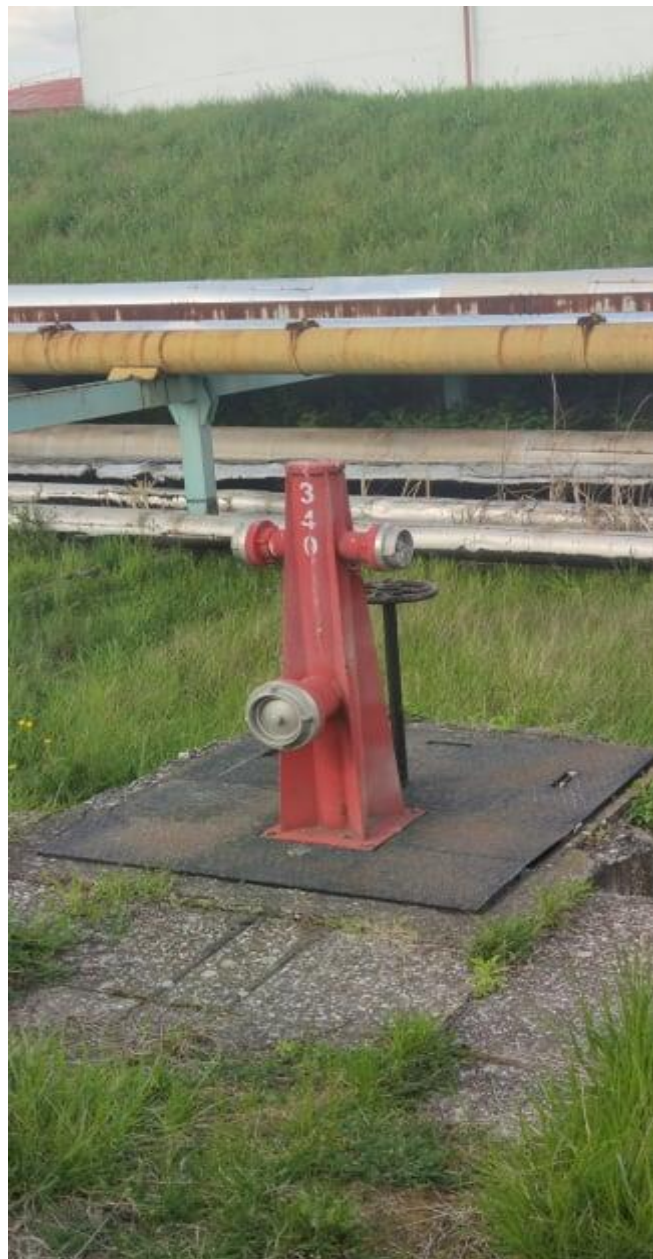
Slika 14. Nadzemni hidrant