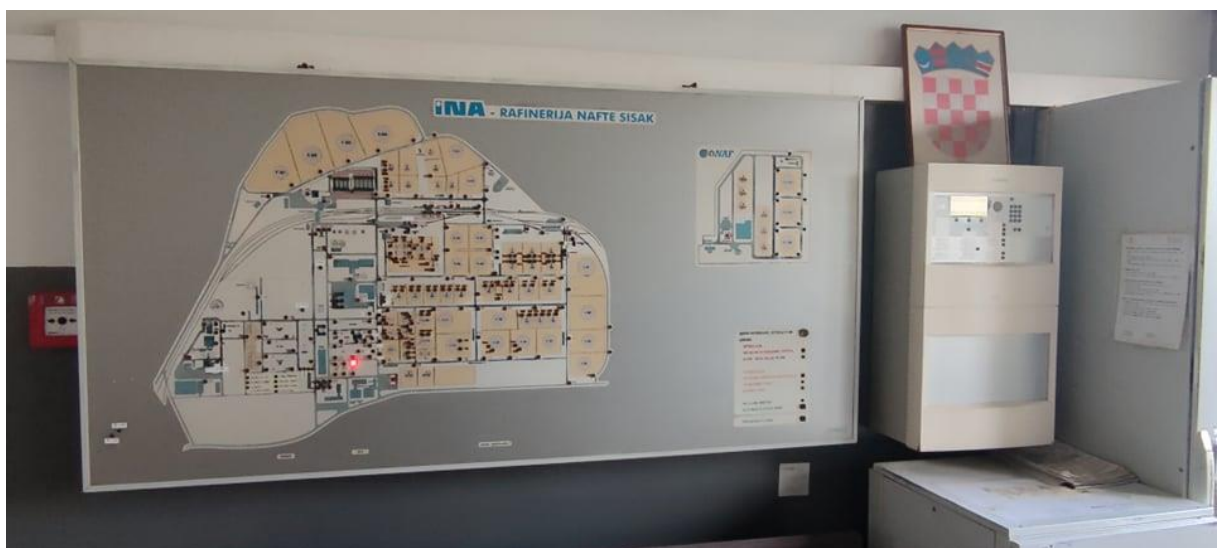
Slika 12. Vatrodojavna centrala

U vatrodojavnoj centrali nalazi se velika mapa rafinerije nafte Sisak sa svim ručnim javljačima to jest točnom lokacijom na kojem se isti nalaze što bitno olakšava izlazak vozila na teren (Slika 12.).