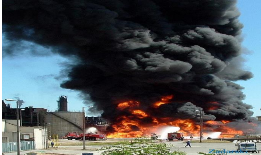
Slika 1. Požar u rafineriji nafte Sisak 2011. godine

Cilj ovog završnog rada je upoznati trenutne aktivne mjere i sustave zaštite u rafineriji nafte Sisak te ukazati na neke propuste samih aktivnih mjera kroz iskustvo i rad. Također je cilj i paralelno sa nedostacima prikazati alternativna i modernija rješenja kad se radi o sustavima zaštite.