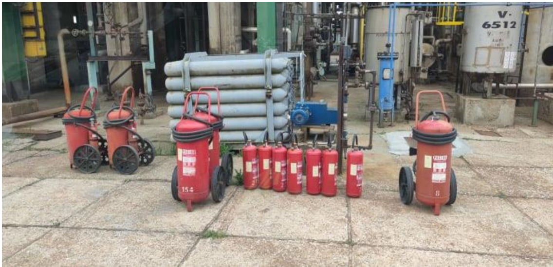
Slika 13. Vatrogasni aparati