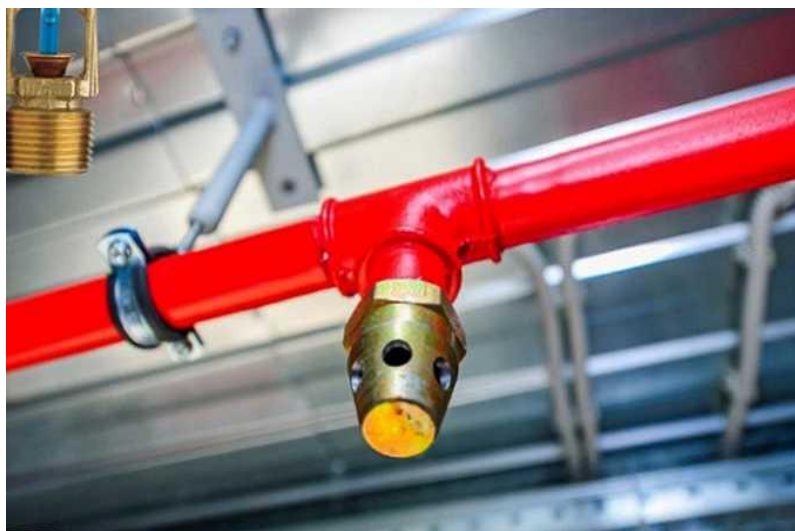
Slika 5. Drencher mlaznica

Kod drencher sustava većinom je voda sredstvo za gašenje, ali po potrebi može biti pjena. Drencher sustavi su izvedeni da služe za gašenje i hlađenje objekta ili za odvajanje i zaštitu objekta.