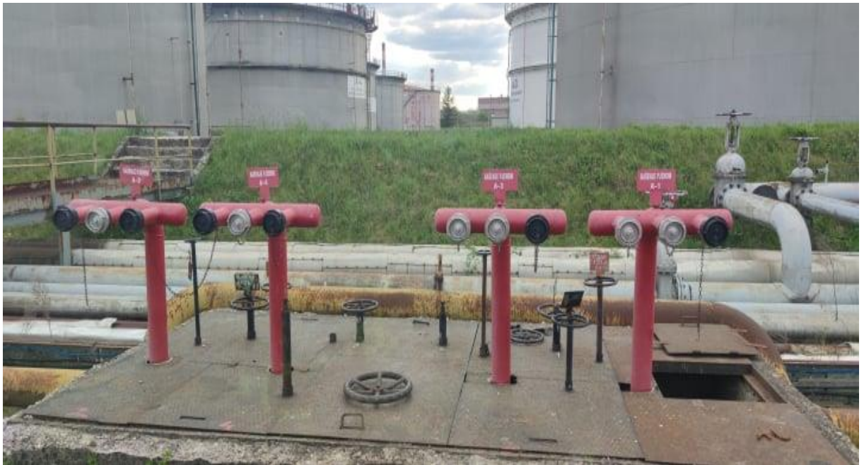
Slika 8. Polustabilni sustavi za gašenje požara zračnom pjenu