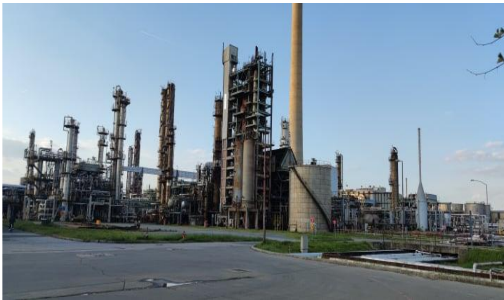
Slika 3. Postrojenje u rafineriji nafte Sisak

Vidljivo je da se u rafineriji nafte nalaze brojne opasnosti te ih je potrebno svesti na minimum te ako do opasnosti i dođe, moramo brzo i učinkovito djelovati. To se može postići jedino ako se provedu mjere zaštite od požara. Od nedavno sva postrojenja unutar rafinerije nafte Sisak su konzervirana te su izvan funkcije rada. Koriste se samo spremnici te sustavi otpreme i dopreme robe. To je rezultiralo s manjim opasnostima od požara pošto postrojenja ne rade, ali i dalje je opasnost u samoj rafineriji od požara velika i postojana.