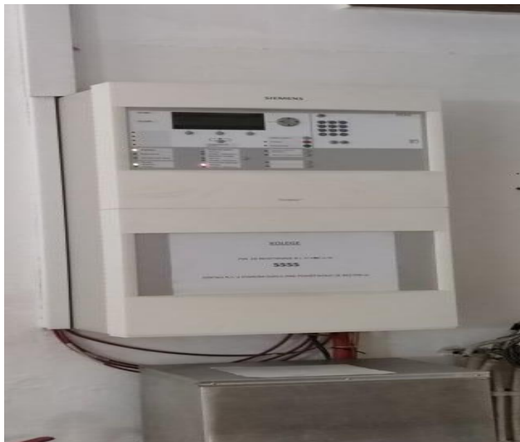
Slika 13. Plinodetekcija u vatrodojavnoj centrali

Detektori plina u Rafineriji nafte Sisak ugrađeni su na spremnike UNP-a (ukapljeni naftni plin), te na postrojenjima poput HDS-a, FCC benzina, SRU i Izomerizaciji gdje su i prisutni plinovi. Svaki plinodetektor ima svoj broj i točnu lokaciju. Kada proradi sustav alarmiraju se centrale plinodetekcije koje se nalaze u kontrolnim salama procesnog osoblja i u vatrodojavnoj centrali (Slika 13.). Servise i održavanje sustava za detekciju plina obavljaju samo ovlaštene servisi s kojima je potpisan ugovor te su oni odgovorni za sustav.