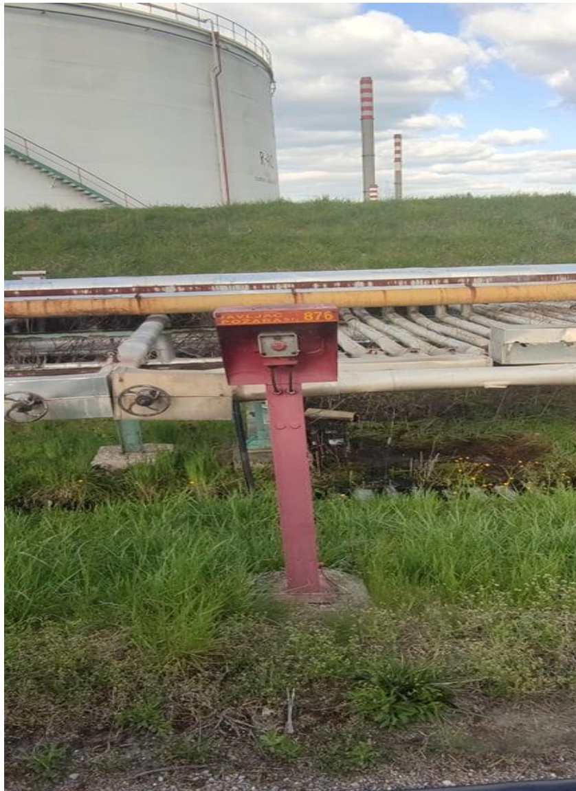
Slika 11. Ručni javljač požara

U vatrodojavnoj centrali nalazi se velika mapa rafinerije nafte Sisak sa svim ručnim javljačima to jest točnom lokacijom na kojem se isti nalaze što bitno olakšava izlazak vozila na teren (Slika 12.).