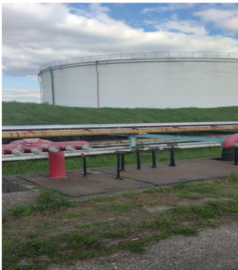
Slika 6. Sustav za hlađenje raspršenom vodom na spremniku

Od ostalih građevina ovakvim sustavom štite se pumpane (Slika 7.), kompresornice, laboratoriji te objekti energetike. Na ovim objektima velika količina vode ne može proizvesti dodatnu štetu kao kod požara zgrade jer voda odlazi u kanalizaciju i zemlju te je potrebna velika količina vode zbog toga što se požar može brzo proširiti.