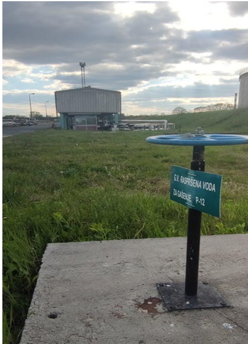
Slika 7. Sustav za hlađenje raspršenom vodom za pumpanu