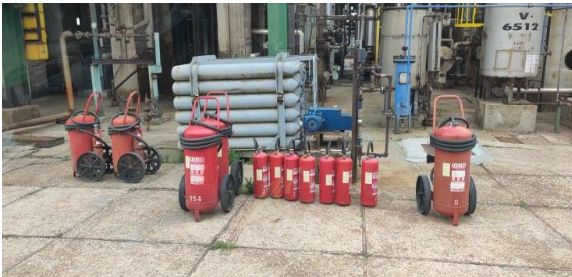
Slika 13. Vatrogasni aparati