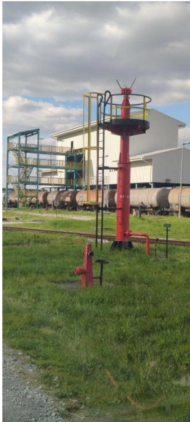
Slika 9. Stabilni bacač

Mobilni bacač je vatrogasni bacač namijenjen za zaštitu postrojenja (Slika 10.). Mobilni bacači mogu se koristiti za gašenje zračnom pjenom i vodom ili mogu služiti za hlađenje objekata vodom. Prednost mobilnih bacača je ta što su mobilni te ih možemo pomicati, ali za razliku od stabilnih bacača nisu povezani direktno na hidrantsku mrežu pa ih je potrebno spojiti na hidrant što iziskuje određeno vrijeme.