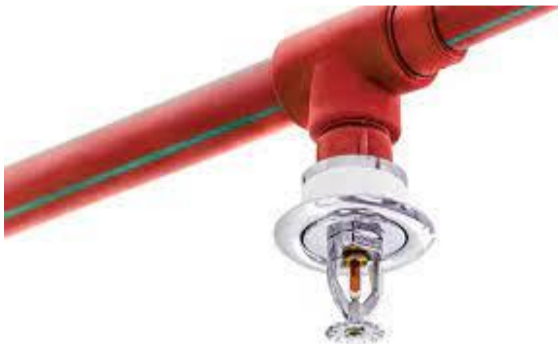
Slika 4. Sprinkler mlaznica

Ovakav sustav se u rafineriji nafte Sisak koristi samo u upravnoj zgradi gdje se nalaze uredi. Na tom je mjestu potrebno da se mlaznice aktiviraju lokalno tako da ne bi proizveli veću štetu.