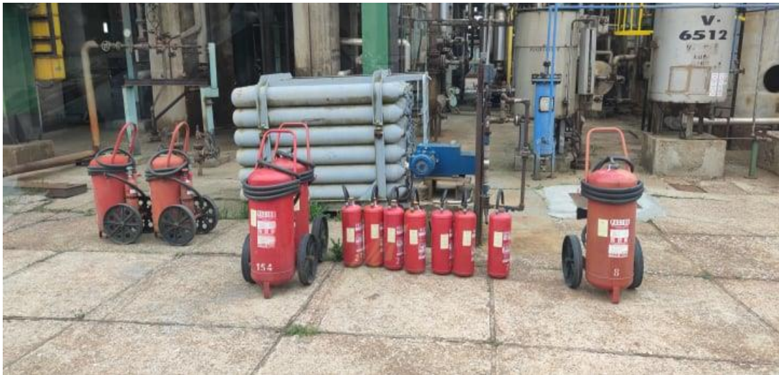
Slika 13. Vatrogasni aparati