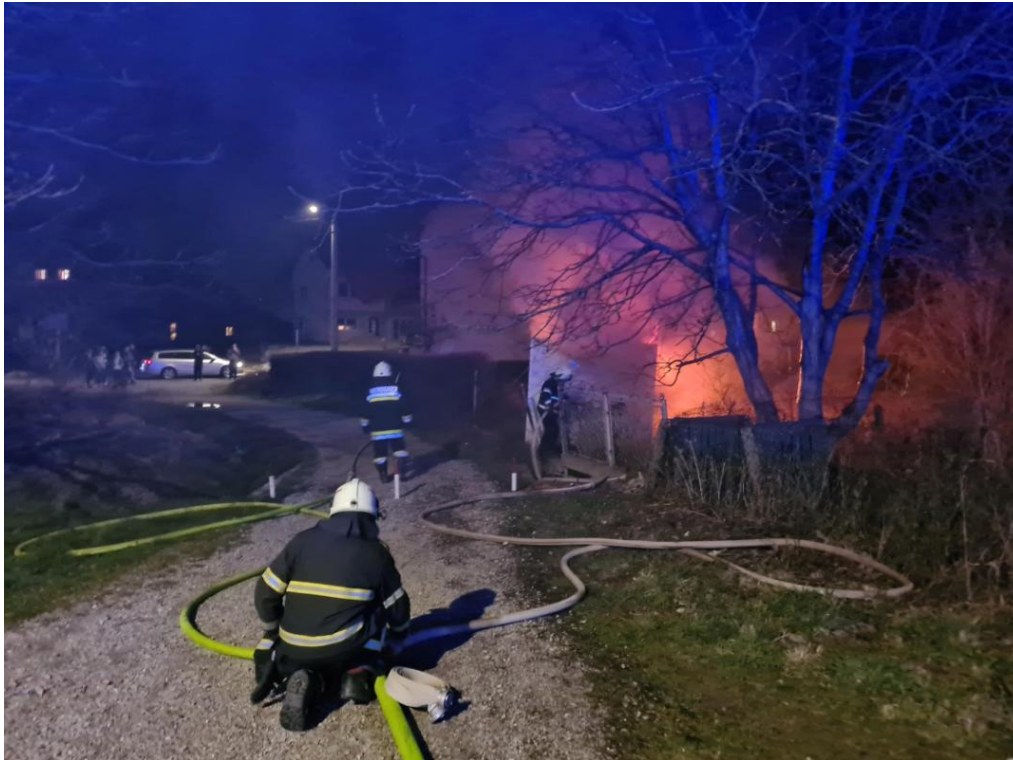
Slika 6. Vanjska navala [7]