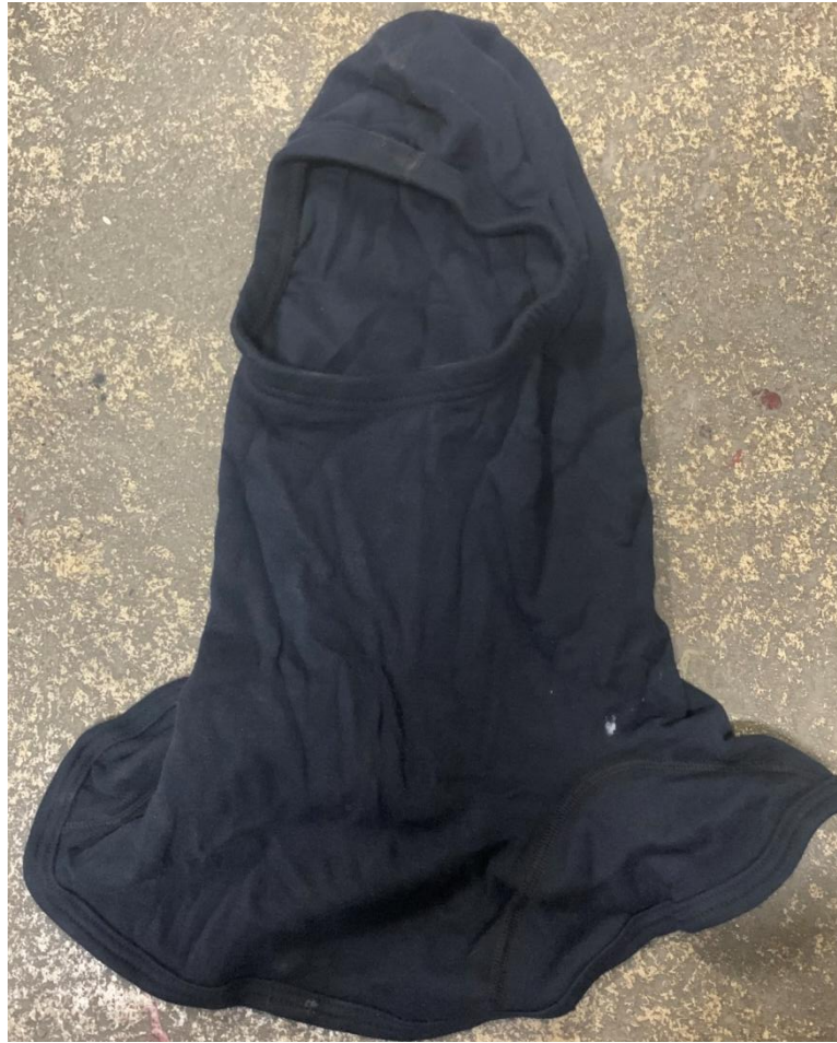
Slika 15. Zaštitna potkapa [7]