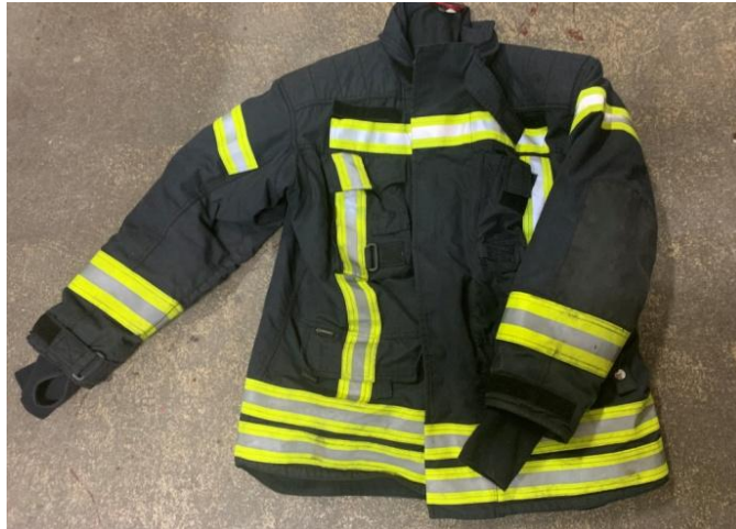
Slika 9. Zaštitno vatrogasno odijelo - jakna [7]