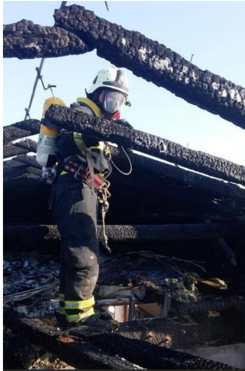
Slika 4. Posljedica nakon flashovera [7]

stakala u prostoriju ulazi svježi zrak koji se miješa s plinovima koji su nastali i dolazi do zapaljenja cjelokupnoga gorivoga materijala. Za nastanak flashovera ne može se precizno odrediti temperaturni parametar pa se za tu pojavu uzima temperatura od 490°C – 650°C i na toj temperaturi nastaje pojava po nazivom flashover. Prilikom gašenja požara u prostoriji najviše se pažnje treba posvetiti direktnom djelovanju na gorivi materijal te odimljavanju prostorije. Predviđeno vrijeme za koje bi se prilikom nastanka flashovera trebalo povući iz prostorije je 8 sekundi, ali to je nažalost malo vremena za povlačenje pa u takvim situacijama vatrogasci najčešće prođu s opeklinama po tijelu koje mogu biti opasne za život. [6]