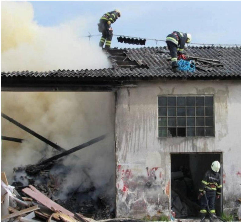
Slika 7. Kombinirana navala [7]