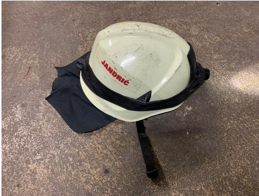
Slika 8. Zaštitna vatrogasna kaciga, Rosenbauer [7]