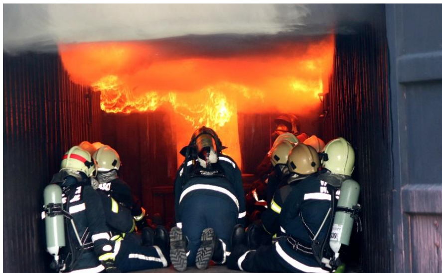
Slika 3. Simulator za backdraft [7]

Predznaci backdrafta: vrijeme trajanja požara- požar u prostoriji jako je kasno otkriven, postoji mogućnost od plamenoga udara; usisavanje zraka- ako se prilikom otvaranja vrata osjeti usisavanje zraka, to je mogući znak se će se dogoditi plameni udar; kvaka na vratima- u slučaju da su kvake vruće, a prostorija zatvorena, to je jedan od predznaka da će se dogoditi plameni udar; dim- u slučaju da dim prilikom izlaženja iz prostorije izlazi u jednakim intervalima, to je predznak da će se dogoditi plameni udar. [6]