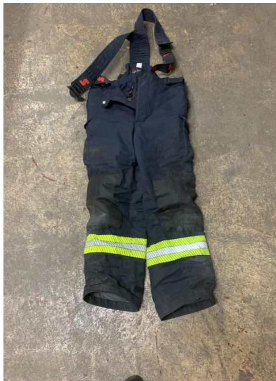
Slika 10. Zaštitno vatrogasno odijelo - hlače [7]

Vatrogasne zaštitne rukavice (slika 11) štite vatrogasce od topline i mehaničkih ozljeda. Europska norma za zaštitne vatrogasne rukavice je EN 659 i u njoj su objašnjeni zahtjevi za zaštitne rukavice koje koriste vatrogasci i predstavljene su metode ispitivanja. [11]