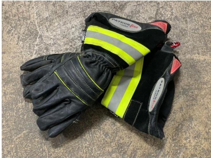
Slika 11. Zaštitne rukavice za vatrogasce [7]