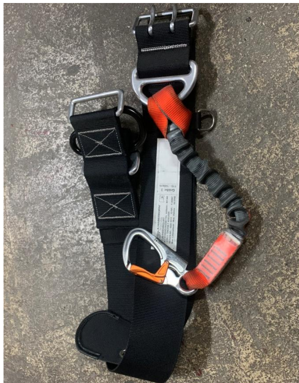
Slika 13. Vatrogasni penjački opasač [7]

Održavanje opasača: čišćenje i pranje opasača; sušenje; postavljanje u slobodno visećem položaju.