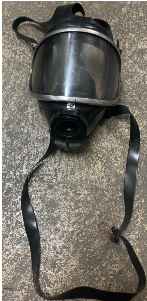
Slika 14. Zaštitna plinska maska na bazi izolacije [7]

Dijelovi plinske maske: priključak maske; ventil (upravljajući); unutrašnja maska; zaštitno staklo; okvir stakla; trake za pričvršćivanje; brtveći okvir; tijelo maske; metalni napinjač; zaštitna kapa; čeona traka.