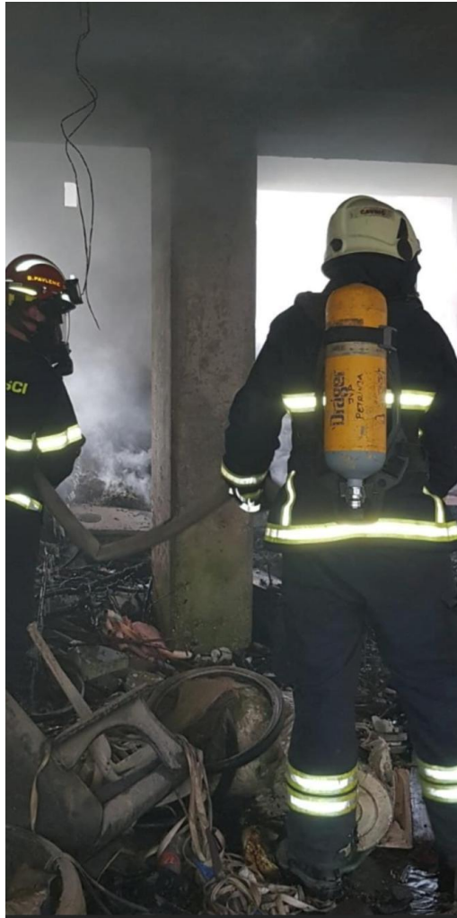
Slika 5. Unutarnja navala [7]