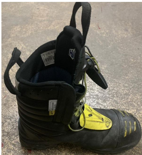
Slika 12. Vatrogasna zaštitna čizma [7]

Osobna zaštitna oprema za zaštitu nogu služi za zaštitu od mehaničkih, toplinskih, kemijskih djelovanja te zračenja (slika 12). Ovisno o radnome mjetu poslodavac mora utvrditi koja radna obuća odgovara radniku. Takva obuća ne smije biti teška, mora biti oblikovana u skladu s ergonomskim uvjetima. Prilikom rada ne smije doći do žuljanja ili znojenja noge, odnosno tijekom kretanja nepoželjne su bilo kakve tegobe. Norma za zaštitnu obuću u vatrogasnoj djelatnosti je HRN EN ISO 20345- Sigurnosna obuća s kapticom za zaštitu prstiju, koja udovoljava specifičnim zahtjevima zaštitne cipele, štiti stopalo od udaraca jačine 200 J (džula). [11]