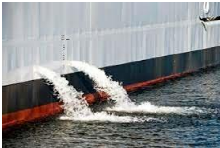
Slika 8. Ispuštanje balastnih voda [23]

Balastne vode su vode koju brodovi sadržavaju zbog svoje ravnoteže i svoje stabilnosti te zbog očuvanja integriteta pri praznom brodu. Kada veliki brod, poput kontejnerskog broda ili cisterne za naftu, istovari teret, morska voda se pumpa u odjeljke u trupu. Slično tome, kada se ukrcava veliko plovilo, iz tih odjeljaka ispušta morsku vodu (slika 8) [22].