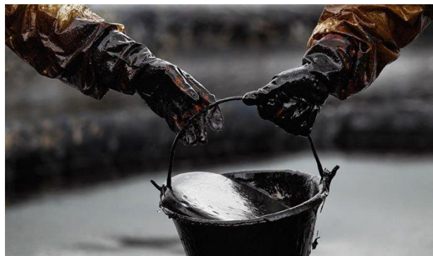
Slika 4. Sirova nafta [13]

Nafta tzv. sirova nafta (slika 4) je fosilno gorivo dolazi od perzijske riječi "nafada" (navlažiti, iznojiti) i grčke riječi "naphta" (zemno ulje). Obično se i naziva "crno zlato". Kod nas su korišteni i nazivi: zemno ulje, kameno ulje, mineralno ulje, zemna smola, a često i internacionalni naziv petrolej. Nafta ima visoku biološku aktivnost jer sadrži velike koncentracije organskih tvari pri čemu dolazi do remećenja ravnoteže ekosustava što je potrebno oko 20 godina da se ekosustav oporavi. Nastaje iz ostataka drevnih morskih organizama kao što su biljke, alge i bakterije. Sirova nafta je smjesa ugljikovodičnih spojeva u rasponu od manjih, isparljivih spojeva do vrlo velikih, neisparljivih spojeva. Ta mješavina spojeva varira ovisno o geološkoj formaciji područja u kojem se nalazi nafta i snažno utječe na njezina svojstva. Na primjer, sirova nafta koja se sastoji uglavnom od krupnih spojeva su viskozna i gusta [12].