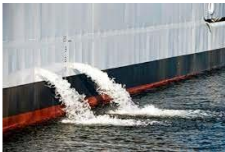
Slika 8. Ispuštanje balastnih voda [23]

Balastne vode su vode koju brodovi sadržavaju zbog svoje ravnoteže i svoje stabilnosti te zbog očuvanja integriteta pri praznom brodu. Kada veliki brod, poput kontejnerskog broda ili cisterne za naftu, istovari teret, morska voda se pumpa u odjeljke u trupu. Slično tome, kada se ukrcava veliko plovilo, iz tih odjeljaka ispušta morsku vodu (slika 8) [22].