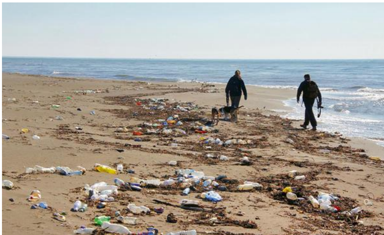
Slika 1. Onečišćena obala smećem [9]