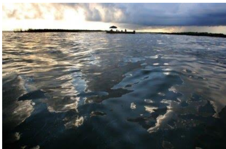
Slika 6. Onečišćena obala naftom [19]

Brodski prijevoz (tankeri) je odgovoran za skoro polovicu naftnog onečišćenja mora, dok otprilike trećinu čine gradski i industrijski otpad. Nadalje, oko 8 % onečišćenja mora dolazi iz naravnih izvora, kao što je curenje nafte na morskom dnu. Na slici 6 prikazana je obala onečišćena naftom [7].