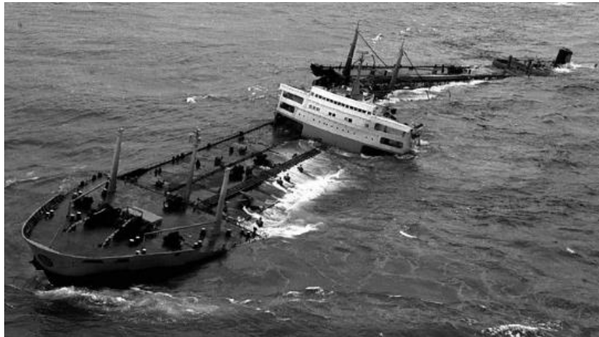
Slika 12. Tanker Torrey Canyon [32]

Supertanker nafte Torrey Canyon u vlasništvu američke podružnice Kalifornije Union Oil Company 18. ožujka 1967. godine prevezio je oko 120 tisuća tona sirove nafte pri čemu se nasukao na morski greben Pollard's Rock između otoka Scillya i britanske obale. Nasukavanjem broda izlilo se oko 117 milijuna litara nafte (slika 12) [30, 31].