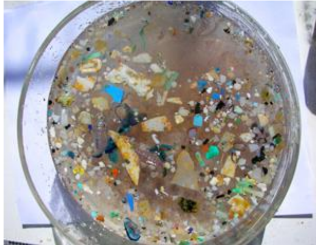
Slika 2. Uzorci mikroplastike u vodi [11]

Mikroplastiku (slika 2) čine čestice veličine manje od 5 cm. Svojom malom veličinom dostupni su u širokom rasponu vodenim organizama koje se prenose preko hranidbenog lanca što predstavlja sve veću zabrinutost. Gutanjem mikroplastike kod ljudi predstavlja potencijalan opasan učinak za ljude što dovodi do promjene u kromosomima pri čemu dolazi do mogućnosti neplodnosti, pretilosti i raka [10].