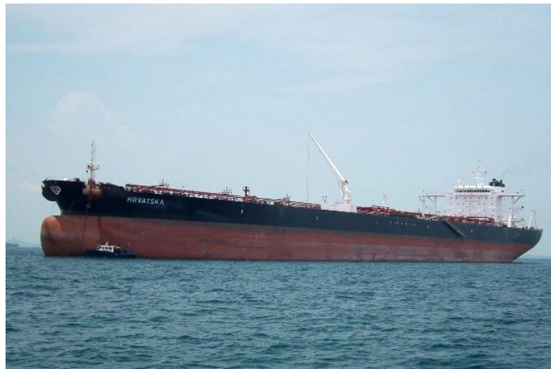
Slika 5. Tanker [17]

Zbog svoga značenja koju nafta danas ima, transport nafte važna je gospodarska grana. Transport nafte osim što se obavlja specijalno opremljenima plovilima pomorskim putem (tankerima), na kopnu se najviše koriste naftovodi i cestovni transport. Na slici 5 prikazan je tanker za transport nafte pomorskim putem. Prijevoz naftnih derivata postoji već od davnina, čak još od trećeg stoljeća prije nove ere [16].