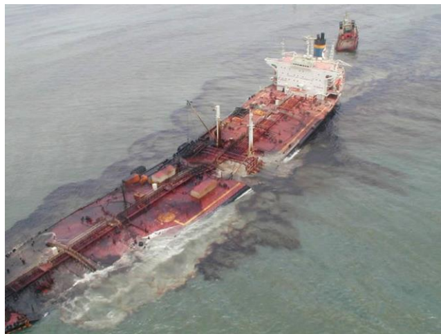
Slika 11. Tanker Tasman Spirit [29]