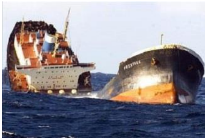
Slika 13. Tanker The Prestige [34]

navodi se kao najveća ekološka katastrofa u povijesti Španjolske i Portugala. Količina izlivena nafte bila je veća od incidenta tankera Exxon Valdeza, a i toksičnost se smatrala većom, zbog viših temperatura vode. Nakon potonuća, olupina je nastavila ispuštati oko 125 tona nafte dnevno, onečišćujući morsko dno i obalu, posebno duž teritorija Galicije. Ekološka šteta bila je najteža na obali Galicije [34].