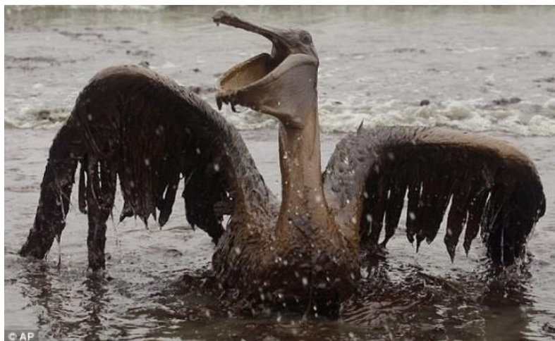
Slika 7. Životinja u nafti [21]

Specifični postupci događanja koji nastaju nakon izlivanja nafte određuju kako se nafta treba očistiti i njegov utjecaj na okoliš. Na primjer, ako nafta brzo isparava, čišćenje je manje intenzivno, ali ugljikovodici u nafti ulaze u atmosferu i uzrokuju onečišćenje zraka. Naftna mrlja mogla bi se nositi površinskim strujama ili vjetrovima u ptičju koloniju ili na obalu na kojoj se tuljani ili morski lavovi uzgajaju i snažno utječu na divlje životinje i njihovo stanište. S druge strane, glatko bi se moglo izvesti do mora, gdje se prirodno dispergira i ima mali izravni utjecaj na okoliš. Izlivena nafta na vodi pretrpjelo je niz promjena u fizičkim i kemijskim svojstvima koje se u kombinaciji nazivaju "vremenske neprilike". Proces vremenskih prilika odvijaju se vrlo različitim brzinama, ali započinju odmah nakon izlivanja nafte u okoliš. Stope vremenskih prilika nisu konzistentne tijekom cijelog izlivanja nafte i jesu obično najviša odmah nakon izlivanja. I procesi vremenskih prilika i brzina kojom se javljaju ovise više o vrsti nafte nego o uvjetima okoliša.