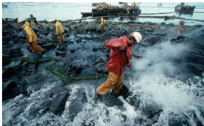
Slika 10. Čišćenje obale Valdez raspršivanjem[27]

otvorila se velika rupa na dnu tankera čime je iscurilo oko 40 000 tona odnosno 40 milijuna litara sirove nafte pri čemu se stvorila najrazornija naftna mrlja. Oštećeno je 8 od 11 brodskih tankova. Nastalo naftno onečišćenje prouzrokovalo je veliku zabrinutost na život i razvoj morskog ekosustava. Nafta mrlja se raširila duž 1700 km obale. Tim nesretnim događajem ova havarija se bilježi najvećom katastrofom na svijetu od strane ljudskog faktora čime je naštetila životinjama i cjelokupnom okolišu. Točan podatak o ukupno uginulim životinjama nema. Okvirno je oko stotinu tisuća uginulih ptica, jelena, vidri te drugih životinja. Ptice su ugibale radi štete plutajuće nafte, a ne zbog otrovnosti naftnih sastojaka. Također je utjecalo na ugibanje i na tisuće riba. Nastalo onečišćenje obale ima posljedice i dan danas. Zaposlenici supertankera Exxon Valdez su zajedno s oko 11 tisuća stanovnika Aljaske pokušavali zbrinuti izlivenu naftu te dovesti okoliš u normalno stanje. Kompanija Exxon je morala platiti kaznu od 100 milijuna dolara i potrošiti oko 900 milijuna za sanaciju štete koju su učinili. Čišćenje nafte s površine mora su provodili prskanjem kemikalijama za raspršivanje nafte u vodi i obali (slika 10) [25, 26].