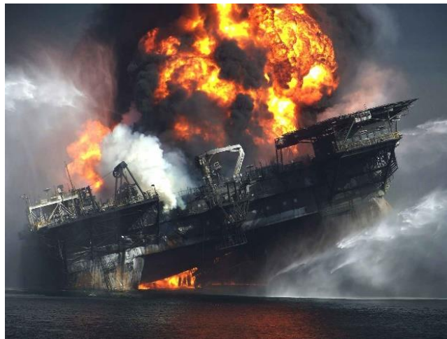
Slika 14. Platforma Deepwater Horizon [37]

Na kraju, kada se ustanovilo da je izljev u potpunosti prekinut procjenjuje se da je u more isteklo između 500 tisuća i milijun tona nafte pri čemu je zahvaćeno ukupno 9 900 km 2 površine. Posljedica ove katastrofe uključivala je tragičan gubitak života radnika, štete zdravlju mnogih stanovnika zaljevske obale i ekološku i ekonomsku katastrofu koja se osjeća i danas. Na površinu je postavljeno otprilike 20 tona disperziva kako bi razdvojili čestice nafte, olakšali biorazgradnju nafte te smanjili utjecaj na onečišćenje obale. Otprilike 17 %