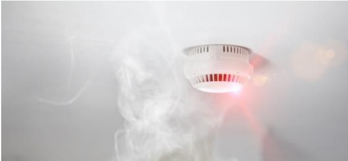
Slika 3. Tradicionalni detektor dima [15]

često prije nego što dim ili plamen postanu vidljivi. Neki moderni sustavi čak koriste umjetnu inteligenciju (AI) za analizu obrazaca i prepoznavanje potencijalnih opasnosti [14].