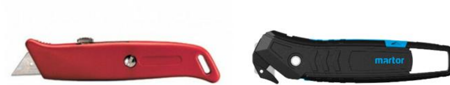
Slika 4. Primjer skalpela sa i bez sigurnosne zaštite na oštrici [19]