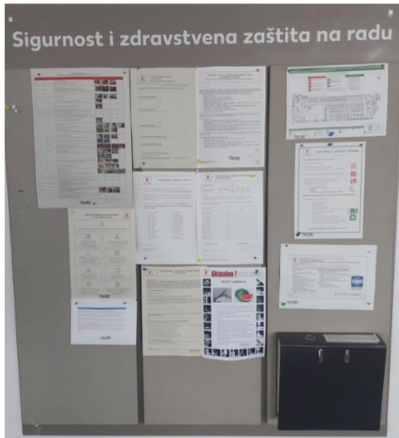
Slika 1. Primjer oglasne ploče u društvenim prostorijama zaposlenika u trgovačkom centru

sigurnijem radnom okruženju i boljoj prevenciji rizika [2]. Na slici 1 prikazan je primjer oglasne ploče u društvenim prostorijama zaposlenika.