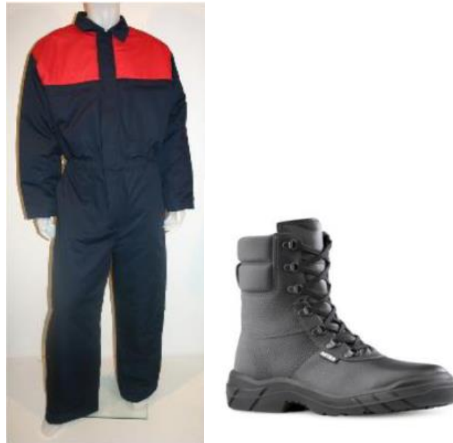
Slika 3. Primjer zaštitne odjeće i obuće koja se koristi u prostorijama niskih temperaturnih režima [8]

uvjetima rada. Isti je potrebno obavljati s dužnom pozornošću koristeći osobnu zaštitnu opremu sukladno uputama proizvođača i u skladu s uputama za rad na siguran način.