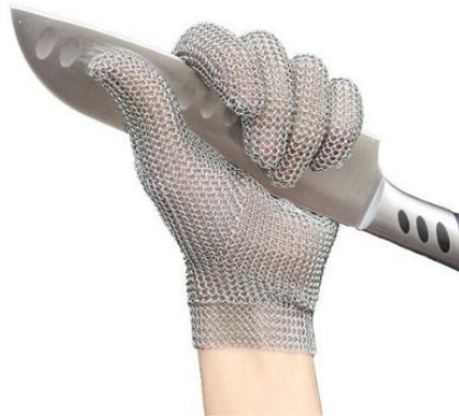
Slika 5. Zaštitna inox rukavica za rad na mesnici [8,19]