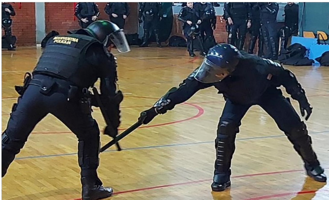
Slika 8. Policijski službenici interventne policije demonstriraju tehnike rukovanja višenamjenskom službenom palicom

Ciljne zone su zelena, žuta i crvena. Zelena ciljna zona uzrokuje minimalnu opasnost povrede osobe, povrede su više kratkotrajne i u nju ulaze sva mišićna područja na tijelu (nadraktice, podlaktice, mišićni dio leđa, ramena, stražnjica, natkoljenice i potkoljenice), žute ciljne zone pružaju srednju opasnost od povreda, povrede mogu biti stalne, duljeg perioda ili kratkotrajne (ključna kost, prsa, donji dio trbuha, laktovi, dlanovi, koljena, stopala, trtična kost) i crvene ciljne zone pružaju veliku opasnost od povreda. Povrede su stalne ili duljeg perioda, mogu dovesti do lomova, nesvijesti, šoka ili čak i smrti (glava, vrat, plexus, kralježnica) [10].