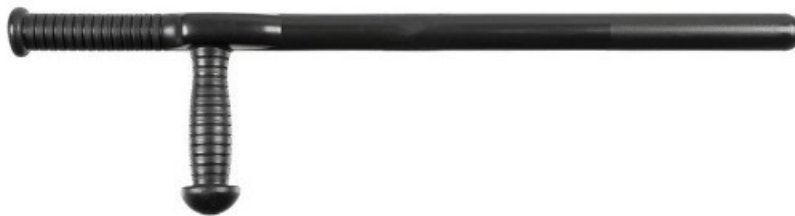
Slika 7. Višenamjenska službena palica „Tonfa“ [12]

Uz opremu za javni red i mir dolazi i višenamjenska službena palica „Tonfa“ (slika 7.) koja uz obrane i blokade služi i za napade te zadavanje udaraca. Prvotno osmišljena u Japanu u 15. stoljeću za obranu seljaka od samuraja i razbojnika zbog zabrane nošenja oružja, tonfa je bila izrađena od drveta i najčešće se radila od ručice za okretanje mlinskog kamena. Modernizirana 80-ih godina prošlog stoljeća tonfu su prvo prihvatili u uporabu u američkoj, a zatim i njemačkoj policiji da bi do 2004. godine bila sastavni dio interventnih i specijalističkih snaga Republike Hrvatske. Moderna tonfa je načinjena najčešće od polikarbonata, a postoje verzije sa stabilizatorom i bez stabilizatora za ublažavanje udarca, odnosno za smanjeno prenošenje traume na ruku policijskog službenika [12].