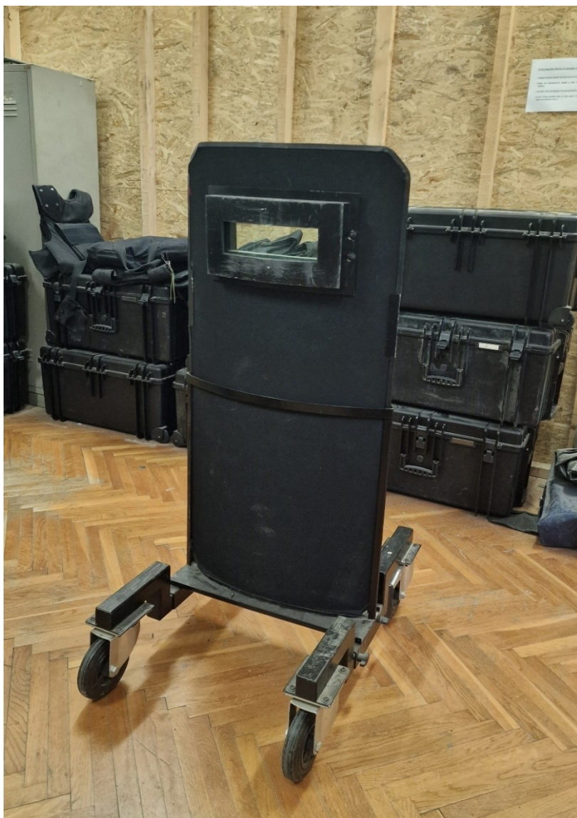
Slika 9. Balistički štit na postolju s kotačima

Razina zaštite III prema NIJ 0108.01 standardu. NIJ nivo III balističkih štitova dizajniran je da osiguraju visok nivo zaštite od metaka i drugih balističkih pretnji i projektila. Ovi štitnici su napravljeni od visoko kvalitetnih materijala, kao što su kevlar, keramika i kompoziti kako bi se osigurala maksimalna zaštita. Dimenzijama od 90 cm visine i 60 cm širine dovoljno je velik da pokrije čitavo tijelo i da posluži kao zaklon. Težina im je od 18 pa do 24 kg, ovisno o razini i količini dodatne opreme koja se na njemu koristi (bljeskalice, taktičke svjetiljke, karabineri, remenje za lakše nošenje itd.). iako je namjenjen većini pištoljskih kalibara kao i standardnih