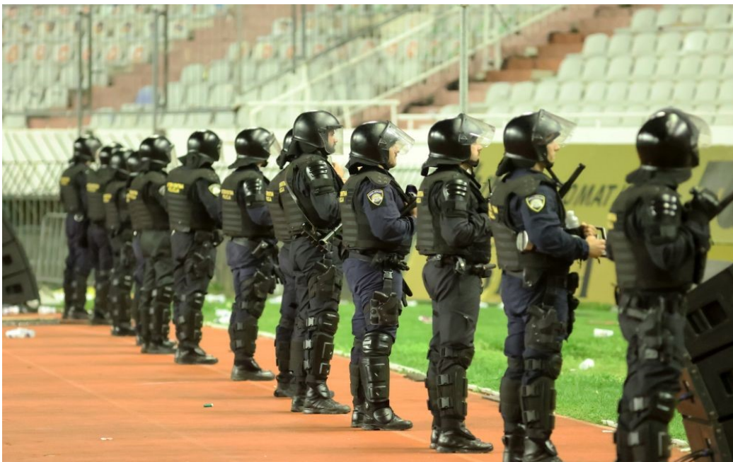
Slika 3. Primjer statodinamičkog napora na radnom mjestu policijskog službenika interventne policije