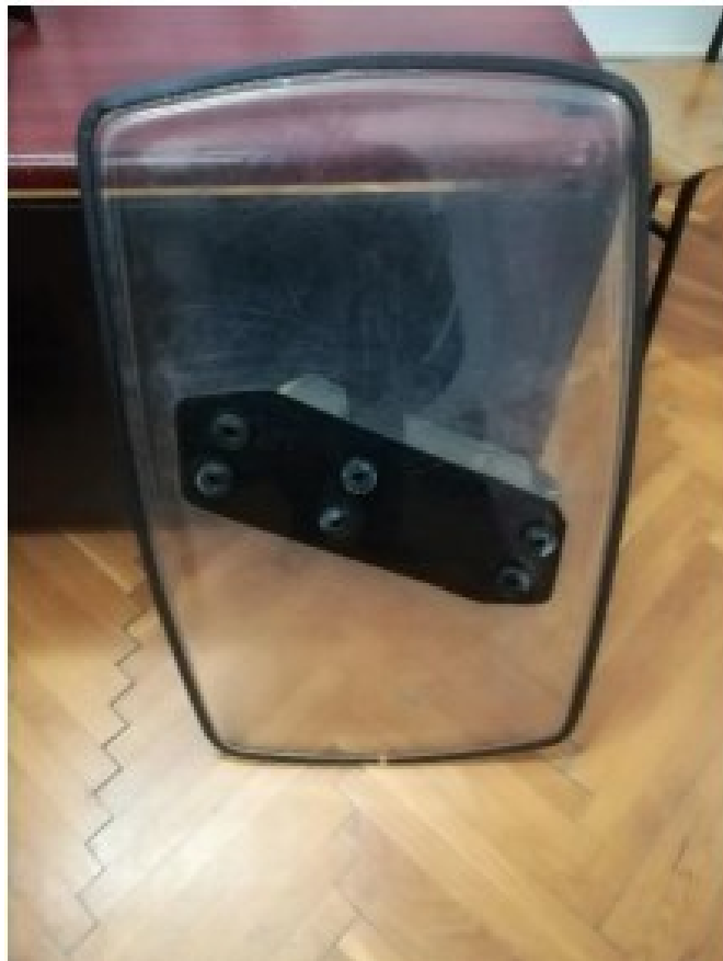
Slika 6. Zaštitni štit opreme za održavanje povoljnog javnog reda i mira

Bitan dio zaštitne opreme je i zaštitni štit (slika 6.) koji je načinjen od polikarbonata, fleksibilan je, nije sklon lomljenju i pucanju. Rubovi su mu dodatno osigurani tvrdom gumom. Visinom od 60 i širinom od 30 centimetara osigurava zaštitu trupa policijskih službenika. Test na udarce i ubod je 147 J, dok mu je debljina 4 milimetara. Najčešće se nosi u slabijoj ruci što pri težini od samo dva kilograma ne iznosi prevelik napor policijskom službeniku kod višesatnog nošenja i korištenja.