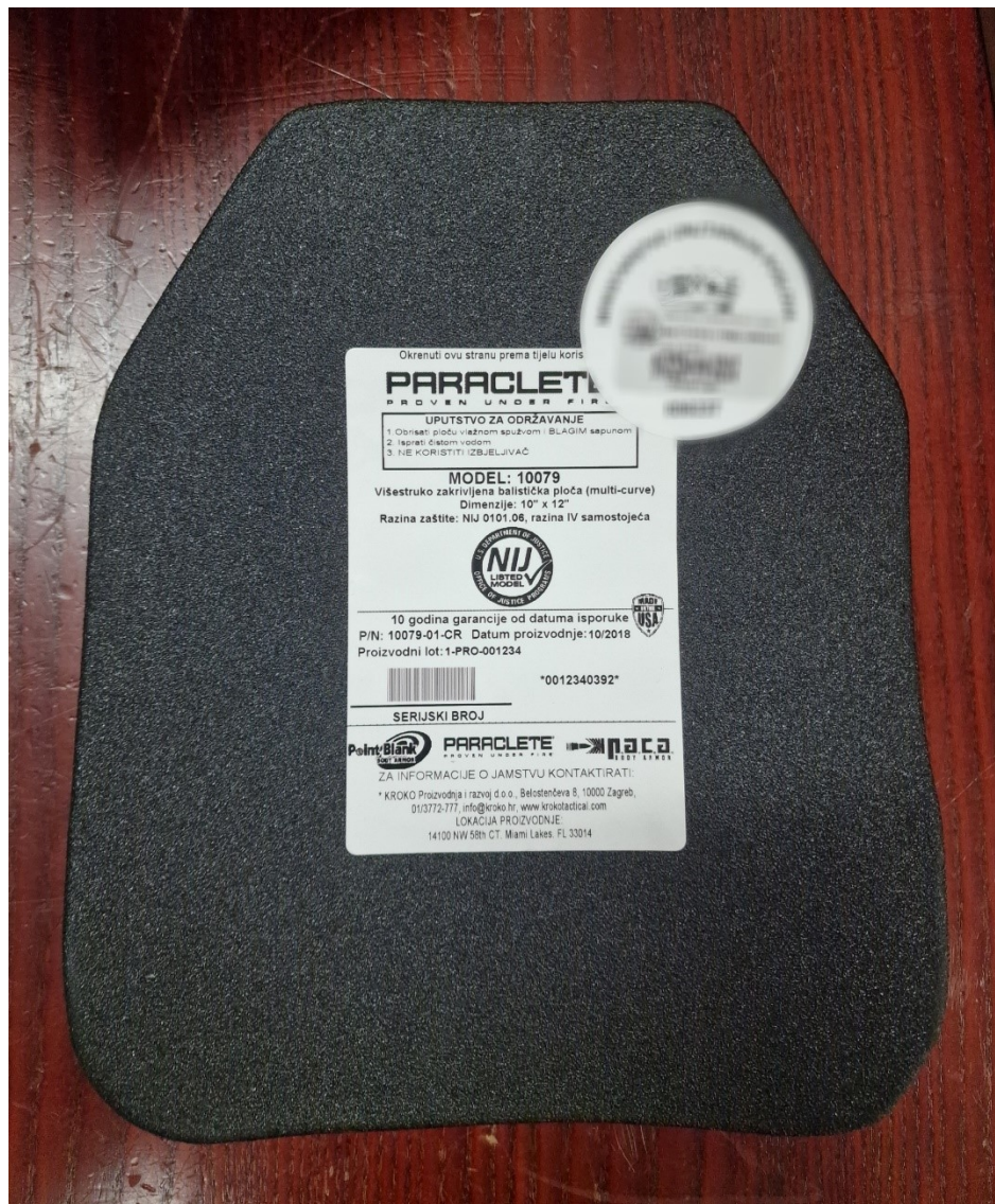
Slika 12. Balistička ploča razine IV sa specifikacijama

prsluka. S unutarnje strane prekriven je spužvom s ventilacijskom mrežicom debljine 6 mm što nudi dodatnu udobnost.