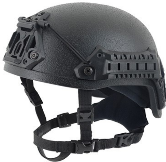
Slika 11. Balistička kaciga Šestan-Busch BK-ACH-HC [15]

Balistička kaciga (slika 11.) koja se koristi je Šestan-Busch BK-ACH-HC nivoa zaštite IIIA. BK-ACH-HC je balistička visoko rezana verzija ACH kacige izrađena od visokokvalitetnih aramidnih vlakna ili UHMWPE (poli etilen ultra-visoke molekularne težine). Lagana je (1280 grama), udobna i zbog nepokrivenosti uha pruža bolji sluh, te mogućnost nošenja slušalica i ostalih komunikacijskih uređaja kao i antifona za zaštitu sluha. Posebni EBSP proizvodni proces osigurava visoku razinu zaštite protiv svih vrsta fragmenata, gelera i metaka [11].