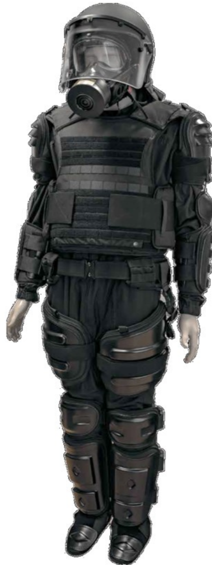
Slika 5. Zaštitna oprema za održavanje povoljnog javnog reda i mira [11]

u mnogome ograničavaju kretanje prilikom obavljanja zadaća i štitnici za potkoljenice koji štite kosti cjevanice i zglobove koljena s prednje strane.