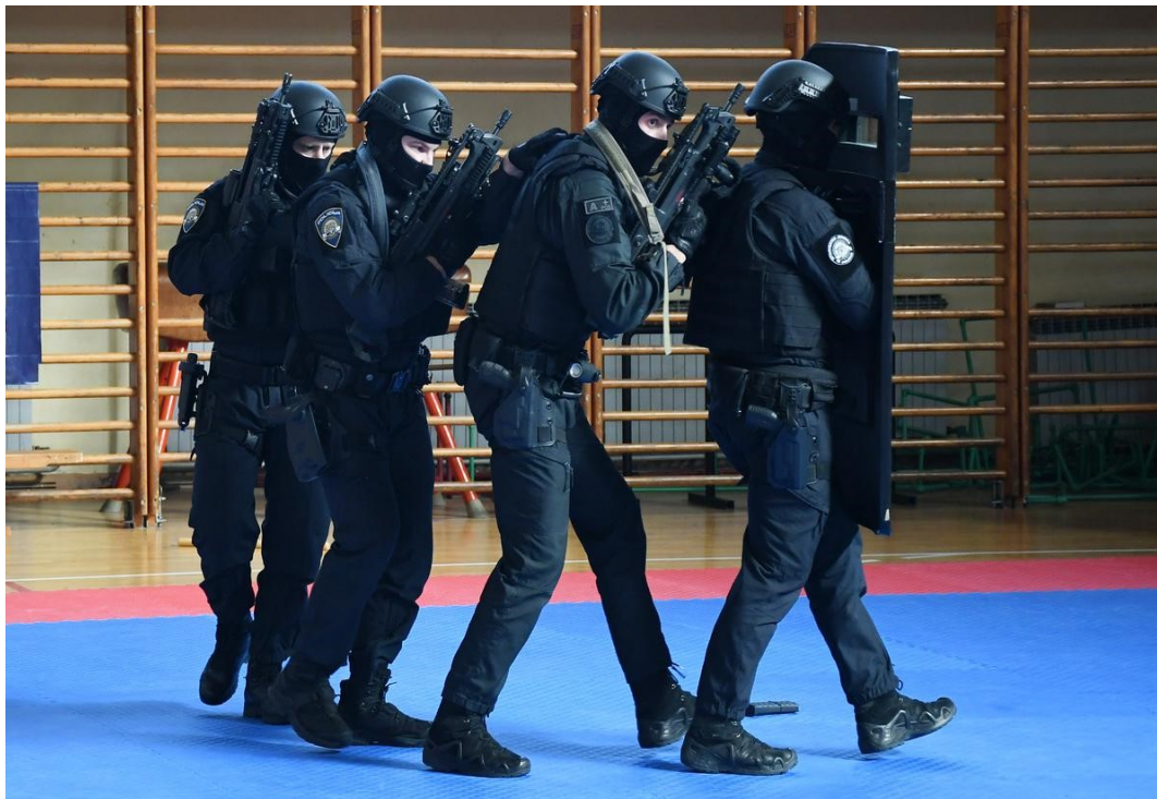
Slika 10. Korištenje balističkog štita razine III prilikom prilaska objektu

slabijih puščanih zrna provjereno zaustavlja i pruža zaštitu od puščanih zrna velike brzine kalibra do 7,62 mm.