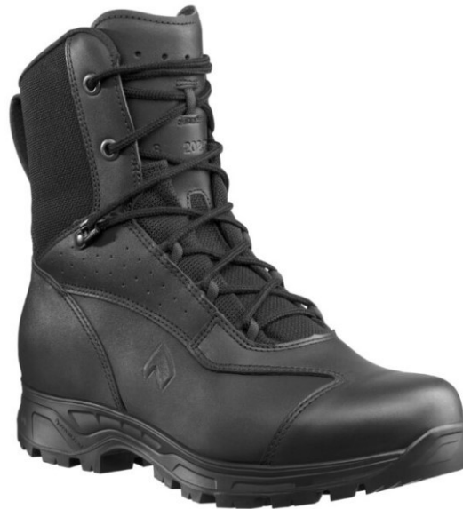
Slika 4. Zaštitna obuća Haix Ranger GSG9-S [10]

Za zaštitnu obuću u specijalističkim timovima interventnih jedinica policije trenutačno se koriste čizme „Haix Ranger GSG9-S“ (slika 4.) izrađene po CE EN 20347:2012 standardima, kožne gležnjače debljine 1,8 do 2,0 mm s prozračnom i vodonepropusnom membranom GORE TEX otporne na bakterije (vrhunska otpornost protiv krvi i tjelesnih tekućina) i s povećanom kemijskom zaštitom. Čizme su antistatične, a visinom od 18,5 cm štite gležnjeve prilikom rada u zahtjevnim uvjetima. Unutarnja tabanica je anatomski oblikovana, periva i brzo se suši. Potplat je gumeni s ulično-terenskim gazom, otporan na habanje i protuklizan, a sustav „Sun reflect“ smanjuje učinak zagrijavanja gornjeg dijela kože u izravnom izlaganju sunčevoj svjetlosti zadržavajući nogu u čizmi hladnom [10].