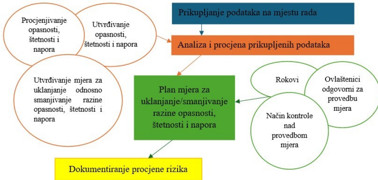
Slika 1. Shema postupka procjene rizika

Prikupljanje podataka na mjestu rada uključuje: