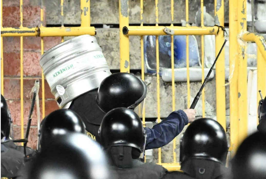
Slika 2. Primjer opasnosti na radnom mjestu policijskog službenika interventne policije