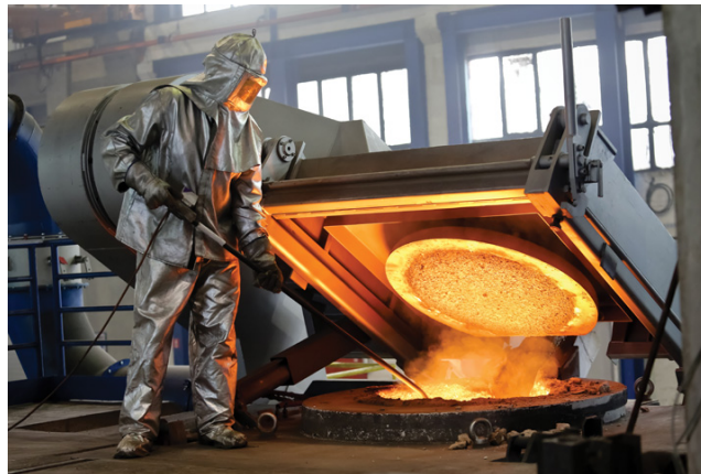
Radnik na peći za taljenje metala u čakovečkom poduzeću Ferro-Preis, 2015.

Bjelovaru → TOMO VINKOVIĆ 1919., Prva jugoslavenska tvornica vagona, strojeva i mostova Brod na Savi (→ ĐURO ĐAKOVIĆ GRUPA; sv. 1) 1921. u Slavonskom Brodu, ljevaonica željeza i tvornica strojeva Dragutin Fleissig Požega (→ PLAMEN; sv. 1) 1922., ljevaonica metala i tvornica strojeva → DALIT (sv. 1) 1938. u Daruvaru, tvornica alatnih strojeva → PRVOMAJSKA (sv. 1) 1946. u Zagrebu, tvornica strojeva i čeličnih konstrukcija → METALAC (sv. 1) 1949. u Čakovcu (danas → FERRO-PREIS; sv. 1), tvornica strojeva i ljevaonica → METAL (sv. 1) 1949. u Hercegovcu, ljevaonica i tvornica kotlovske opreme → METALAC (sv. 1) 1961. u Konjščini i dr. Također, pojačana brodograđevna djelatnost (→ BRODOGRADNJA; sv. 1) u hrvatskim brodogradilištima utjecala je na potrebe povećanja metalurške djelatnosti.