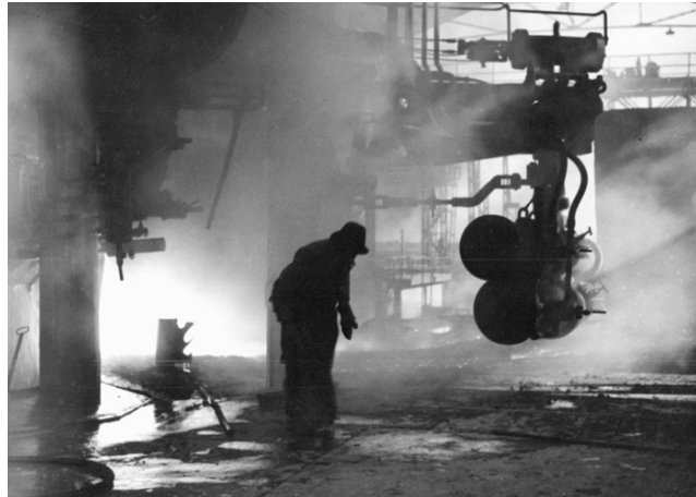
Ljevač na visokoj peći, Željezara Sisak, druga polovica XX. st.

međuproizvoda. Proizvodnjom sirova željeza postiže se bolje odvajanje metala od troske, ali se istodobno iz rude u sirovo željezo reduciraju prateći elementi. Izravni redukcijski procesi osiguravaju manji udio neželjenih primjesa u željezu.