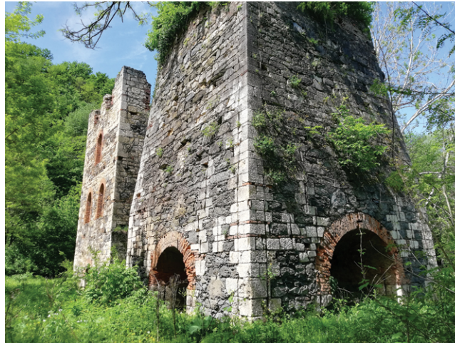
Visoke peći Bešlinec

Nakon I. svj. rata nastavilo se vaditi željeznu rudu na Trgovskoj gori. Prema statističkim podacima rudarstva Kraljevine Jugoslavije, ukupna proizvodnja željeza u talionicama Topusko (Vranovina) i Bešlinac u razdoblju 1919–37. iznosila je 1000–10 000 t na godinu, a zaposlenika je bilo 149. Godine 1941. Bešlinac je kupilo poduzeće Bata (→ BOROVO). Najviše su se proizvodili čavli, potkovice i zakovice za cipele, a još je prve godine ljevaonica proizvodila dijelove za bicikle, pribor za jelo i odljevke od sivoga lijeva.