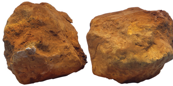
Limonit, Mineraloška zbirka Metalurškoga fakulteta u Sisku

Kemijski čisto željezo proizvodi se rijetko zbog umanjenih fizikalnih i mehaničkih svojstava te složenijih i skupljih proizvodnih postupaka u odnosu na čelik, ali i zbog uporabe ograničene samo na područje metalurgije praha, katalizu te proizvodnju specijalnih magneta.