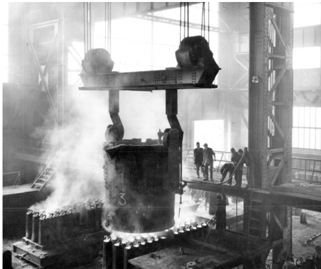
Lijevanje čelika iz velikog lonca u kalupe, Željezara Sisak, druga polovica XX. st.