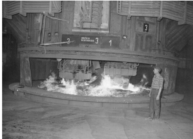
Gornji sloj peći za proizvodnju ferolegura, Tvornica elektroda i ferolegura Dalmacija – Dugi Rat, druga polovica XX. st.