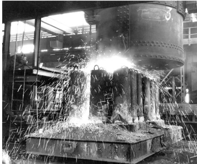
Lijevanje čelika iz velikog lonca u kalupe, Željezara Sisak, druga polovica XX. st.

Do Domovinskoga rata proizvodnja čelika s preradbom iznosila je približno 450 000 t čelika na godinu. Sukladno tomu, metalna je industrija SRH 1985. obradila ukupno 409 200 t čeličnih proizvoda, 35 500 t ljevaoničkoga koksa, 73 000 t sirova željeza, 19 800 t starog željeza. Osim sisačke željezare, Hrvatska je imala i drugih metalurških poduzeća koja su proizvodila materijale na bazi željeza. Ističu se → ŽELJEZARA SPLIT, → TVORNICA ELEKTRODA I FEROLEGURA iz Šibenika, → TVORNICA KARBIDA I FEROLEGURA DALMACIJA – DUGI RAT iz Dugog Rata, → ARMKO iz Konjščine, Valjaonica Kumrovec, Histria tube iz Potpićana u Istri i dr. Danas se proizvodnja željeza u RH znatno smanjila, Godine 2019. proizvodnja čelika iznosila je 68 000 t, dok je 2020. pala na 47 000 t.