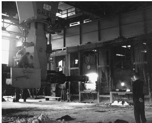
Ulaganje uložaka u Siemens-Martinove (SM) peći, Željezara Sisak, druga polovica XX. st.