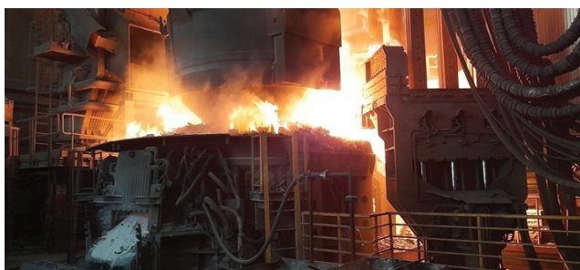
Ulaganje pripremljenoga starog željeza u elektrolučnu peć, ABS Sisak, 2021.

Od željeznih slitina važne su i ferolegure. One uz željezo sadržavaju i velik, često i pretežan udio drugih metala. Od njih se ne izrađuju konačni proizvodi, nego služe za dodavanje drugih elemenata u taline čelika i lijevanoga željeza radi legiranja, te za uklanjanje nepoželjnih sastojaka iz talina. Važnu uporabu pronalaze spojevi željeza poput ferocena kao katalizatora, te ferita, prikladnog za primjenu u tehnici visokih frekvencija, kao magnetskog materijala za memorije elektroničkih računala, za jezgre električnih zavojnica, visokofrekventnih transformatora i magnetskih antena (tzv. feritnih antena).