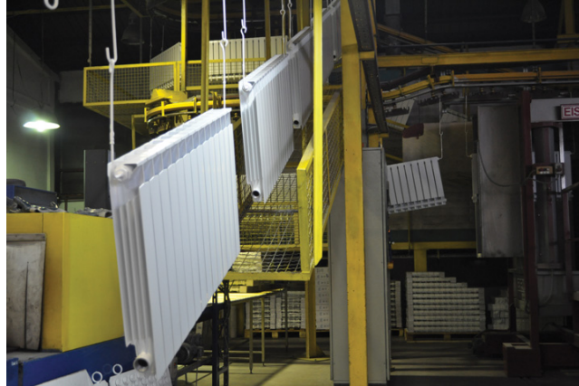
Aluminijski radijatori spremni za pakiranje, tvornica Lipovica