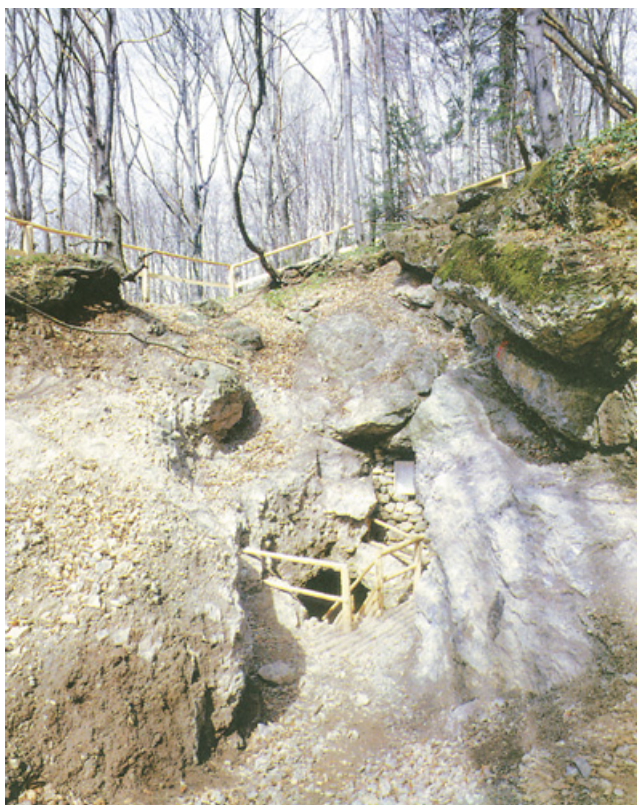
Ulaz u rudnik olova i srebra Zrinski na Medvednici

povlasticom Zrinski najprije koristio za rudarenje u Gvozdanskom na Banovini, a potom i za otvaranje rudnika na Medvednici i u Gorskom kotaru (Lič i Čabar). Najintenzivnije rudarenje srebronosnih galenita na Trgovskoj gori odvijalo se 1463–1578., kada je eksploatirano 25 000–40 000 t ruda olova te proizvedeno 2000–4000 t olova i 800–1400 kg srebra. U to doba u dolini potoka Majdana postojao je veći broj manjih rudnika i 17 talionica za olovo i srebro. Nikola III. Zrinski kovao je u Gvozdanskom srebrne ugarske fenike, groše i talire od 1524. sve do smrti 1534. Prema nekim zapisima, u Gvozdanskom se još 1529. dobivalo 1180 lota (19,60 kg) srebra na mjesec. O rudarenju na Medvednici svjedoče zapisi iz XVII. st. Godine 1608. ili 1610. građani Zagreba kopali su zlatne i srebrne rude, zbog čega ih je tužila udovica Stjepana Gregorijanca, vlasnica Medvedgrada. Na Medvednici je bilo pokušaja istražnih radova i u XIX. st. U Zagrebu je 1936. otvorena Rafinerija plemenitih kovina u današnjoj Tratinskoj ulici, koja posluje i danas, a nakon II. svj. rata pokrenuto je poduzeće → IKOM (sv. 1), koje se među ostalim, bavi kovanjem predmeta od plemenitih metala.