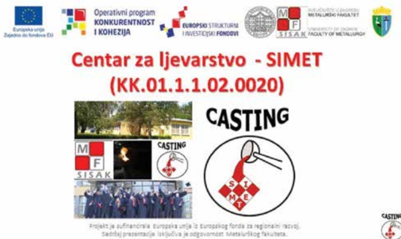
Slika 4: Predstavljanje i vizualne oznake projekta Centra za ljevarstvo - SIMET

Metalurška proizvodnja smatra se jednim od glavnih čimbenika koji utječe na razvoj svjetske ekonomije. U svijetu je ona profitabilna dok je u Republici Hrvatskoj identificiran niz problema, među kojima su loše poslovno okruženje, nedostatak investicija te loša komunikacija između malih i srednjih poduzetnika iz područja metalne industrije, znanstvenih institucija, visokih učilišta te lokalnih i regionalnih vlasti. Projekt Centra za ljevarstvo – SIMET je prilika za promijeniti okolnosti. Uvažavajući teorijska znanja, metalurška struka snažno se oslanja na gospodarstvo u međusobnoj razmjeni znanja i iskustva. U okviru Centra za ljevarstvo – SIMET, predviđene aktivnosti istraživanja i razvoja, uz ostale aktivnosti povezane s uvođenjem inovacija u poduzeća, neophodne su za pozicioniranje, prepoznatljivost izvrsnosti Metalurškog fakulteta, prepoznatljivost i vidljivost Sveučilišta u Zagrebu, povratak Siska i Sisačko-moslavačke županije u status centra atraktivne znanstvene izvrsnosti, procesnih znanja i kompetencija te niše za razvoj gospodarstva Republike Hrvatske.