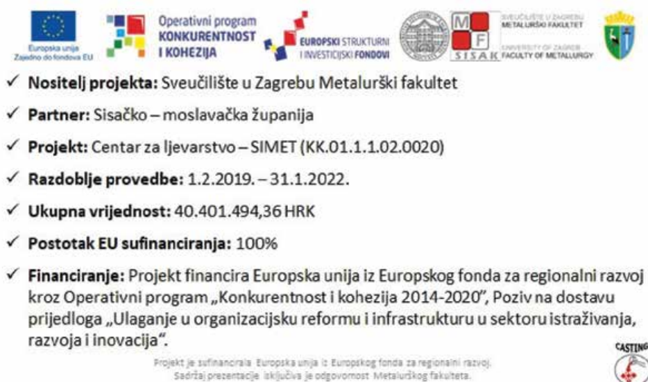
Slika 2: Opće informacije o projektu Centar za ljevarstvo - SIMET

Suočeni sa sve nižom stopom ulaganja u istraživanja i razvoja u bruto društvenom proizvodu (BDP-u) Republike Hrvatske u usporedbi sa srednjom vrijednošću udjela u Europskoj uniji, prepoznavanje ove projektne ideje uvrštavanjem na indikativnu listu projekata te implementacija projekta Centar za ljevarstvo - SIMET kroz projekt u okviru Priprema zalihe infrastrukturnih projekata za Europski fond za regionalni razvoj 2007.-2013. te konačnu implementaciju projekta kroz Europski fond za regionalni razvoj, Operativni program Konkurentnost i kohezija 2014.-2020. u okviru poziva „Ulaganje u organizacijsku reformu i infrastrukturu u sektoru istraživanja, razvoja i inovacija“ predstavlja direktnu potporu hrvatskom obrazovnom sustavu s naglaskom na visokoškolsko obrazovanje i gospodarstvu s općim informacijama o provedbi prikazanim na slici 1.