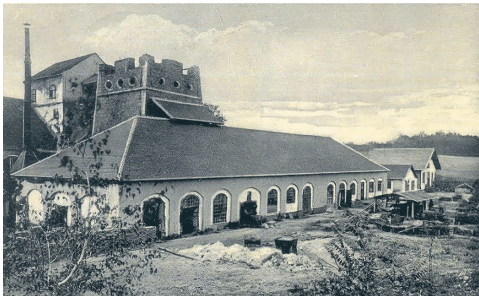
Sl. 4. Kamena visoka peč u Velikoj Vranovini