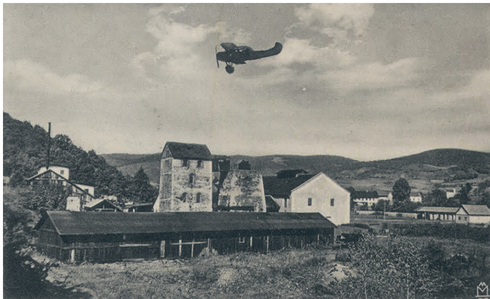
Sl. 3. Kamena visoka peč u Bešlincu