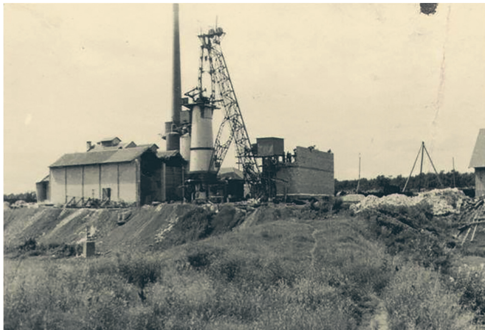
Sl. 5. Talionica Caprag

Hrvatske, u ratnim se godinama, Talionica Caprag suočila sa brojnim poteškoćama u radu zbog manjka radne snage i otežane dobave ruda i koksa što je rezultiralo osjetnim padom proizvodnje.