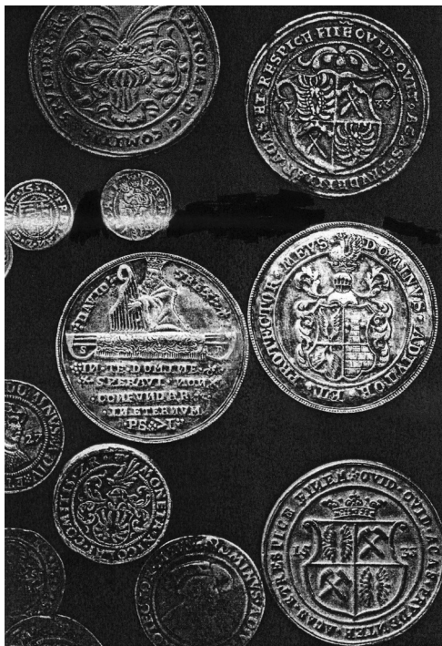
Sl. 2. Novac iz kovnice Zrinskih u Gvozdanskom od 1520. do 1534. g. [10]

je istraživanje ruda željeza u širem području Gvozdanskog, Resanovića i Kosne [16]. Početno su krenula otkapanja isključivo ruda željeza, a kasnije i ruda bakra (1840.-1874. g), te u minimalnim količinama i ruda olova. Od 1778. do 1805. g. nađene su, između ostalog, i rude željeza na nizu mjesta od Vojnića preko Gvozda do Gline, te od Petrovca do Peckog, kao i tragovi prastarih rovova i peći za taljenje kraj Perne i Maličke. Istraživali su se reviri Zrin i Ferdinand (Čatrnja, južno od Gvozdanskog) te ležišta ruda bakra. Proizvodnja u rudniku Zrin počela je krajem 18. i početkom 19. st., a manja količina rude olova otkopana je od 1858. do 1876. g. kad se u Bešlincu osim bakrove talilo i nešto rude olova (sveukupno oko 100 t). Prema podacima iz 1906. g. ruda iz Zrina sadržavala je 27,45 % olova i 1003 g srebra po toni rude, a ruda olova iz Simona potoka (rudnik "Franc") 24,90 % olova i 1100 g srebra po toni rude [10].