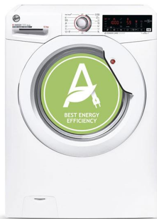
Slika 3. Primjer stroja za pranje rublja koji je proizveden na ekološki način (21)

Štednja vode jednako je važna kao i štednja energije. Kao rezultat toga, dizajneri bi trebali težiti stvaranju kućanskih aparata itd. koji troše znatno manje vode (20). Na slici 3. prikazan je proizvod namjenjen za smanjenje zagađenosti vode, smanjenje potrošnje, uz uštedu novca, energije i manju štetnost okoliša jer smanjuje emisiju ugljičnog dioksida i drugih stakleničkih plinova (21).