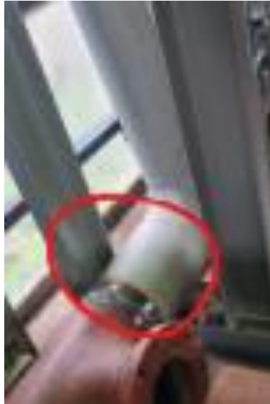
Slika 6. Prikaz obujmice koju je radnik oslobađao

Analizom događaja i dokaza te neposrednim očevidom na mjestu rada utvrđeno je da je ozlijeđeni radnik svojim postupcima doprinio nastanku ozljede na radu odnosno da radnik nije postupio sukladno naučenom i uputama koje je dobio.