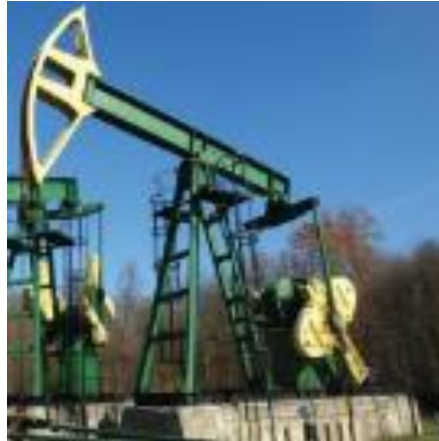
Slika 7. Prikaz njihalice

Kako bi obavio posao pomicanja utega na njihalici koja je prikazana na slici 7., djelatnik se putem ljestvi popeo na njihalicu, na visinu od 3m, sjeo na ekscentar, osigurao zaštitnim pojasom te počeo udarnim ključem i čekićem odvijati vijke. U jednom trenutku, iz lijeve ruke mu se izmaknuo čekić i udario ga u srednji prst desne ruke. Inače se ovaj tip posla obavlja iz hidraulične košare, ali zbog nemogućnosti pristupa vozila predmetnoj njihalici, posao se obavljao na ovaj način.