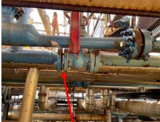
Slika 4. Prikaz prirubnice na kojoj je došlo do propuštanja zraka

Dana 09.03.2022. oko 09:30 radnici su izvodili radove otpuštanja vijaka na postrojenju, linija industrijskog tlaka 313-3-AP-001. Radovi su započeti nakon što je izdana dozvola za rad. Do incidenta je došlo prilikom otpuštanja vijaka kada je zbog naglog rasterećenja došlo do propuštanja zraka pod tlakom iz cjevovoda, kako je i prikazano na slici 5. Te do udara radnika po lijevoj strani lica te potkoljenici i zapešću drugog radnika. Odmah po incidentu obaviještene su sve odgovorne osobe, te je radnicima pružena prva pomoć od strane kolega. Prilikom izvođenja radova radnici su koristili propisanu zaštitnu opremu (antistatik odjeću, visoku obuću sa zaštitnom kapicom, kacigu, zaštitne rukavice i naočale). Potencijalni ishod incidenta je mogao biti smrtni slučaj ili trajni invaliditet.