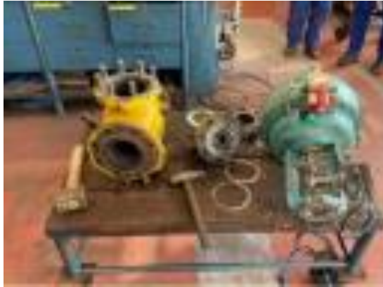
Slika 3. Prikaz servisiranog sigurnosnog ventila

Dana 18.01.2022. oko 12:00 sati prilikom izvođenja radova servisa sigurnosnog ventila na radnom stolu u instrumentacijskoj radionici, prilikom naglog otpuštanja aktuatora radniku je došlo do zaglavljivanja malog prsta desne ruke i rotacije zajedno s ventilom. Odmah po incidentu obaviještene su sve odgovorne osobe, te je radnik upućen na Hitni bolnički prijem. Analizom događaja i dokaza te neposrednim očevidom na mjestu rada ustanovljeno je da je kvar na opremi (ventilu) prikazanom u slici 4. koji nije prepoznat u trenutku rastavljanja doveo do ozljede prsta radnika.