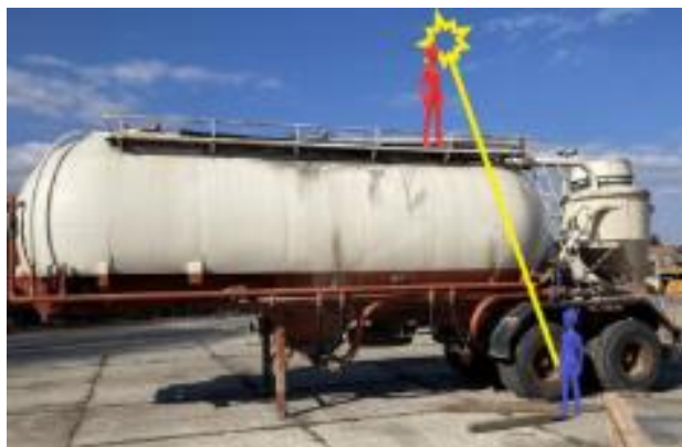
Slika 3. Prikaz incidenta s visokotlačnim peračem

Analizom događaja i dokaza, te neposrednim očevidom na mjestu rada zaključuje se da radnicima nisu dodijeljeni ti poslovi prema procjeni rizika, stoga nisu putem osposobljavanja za rad na siguran način upoznati s opasnostima i mjerama zaštite prilikom izvođenja poslova čišćenja s visokotlačnim peračem, niti posjeduju važeća liječnička uvjerenja za obavljanje tih poslova. Zbog nedostatka osposobljavanja, propustili su koristiti obveznu zaštitnu opremu za zaštitu očiju i primijeniti siguran radni postupak, odnosno ugasiti perač prilikom dodavanja mlaznice.