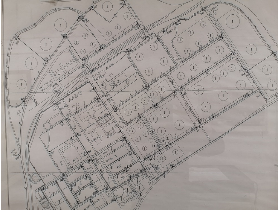
Slika 9. Prikaz hidrantske mreže na spremničkom prostoru

Puštanje u rad sustava za hlađenje i gašenje obavlja se pomoću okna koje sadrži ventile koji se pojedinačno otvaraju za potrebe hlađenja plašta spremnika ili krova spremnika i gašenja s tlačnim dozatorima pjene.