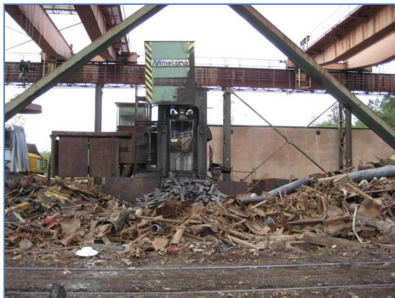
Slika 7. Uređaj za sječu i usitnjavanje čeličnog otpada [22]

Čelični otpad se zatim priprema postupcima sječenja kako bi se prilagodio karakteristikama peći, slika 7, nakon čega se ulaže u košare i kranom odvozi na ulaganje u ELP. Za vrijeme sječenja obično dolazi do rasipanja ili prolijevanja onečišćujućih tvari koje su u čeličnom otpadu najčešće prisutne u obliku različitih prahova, nakupina, tekućih fluida, taloga i slično [10].