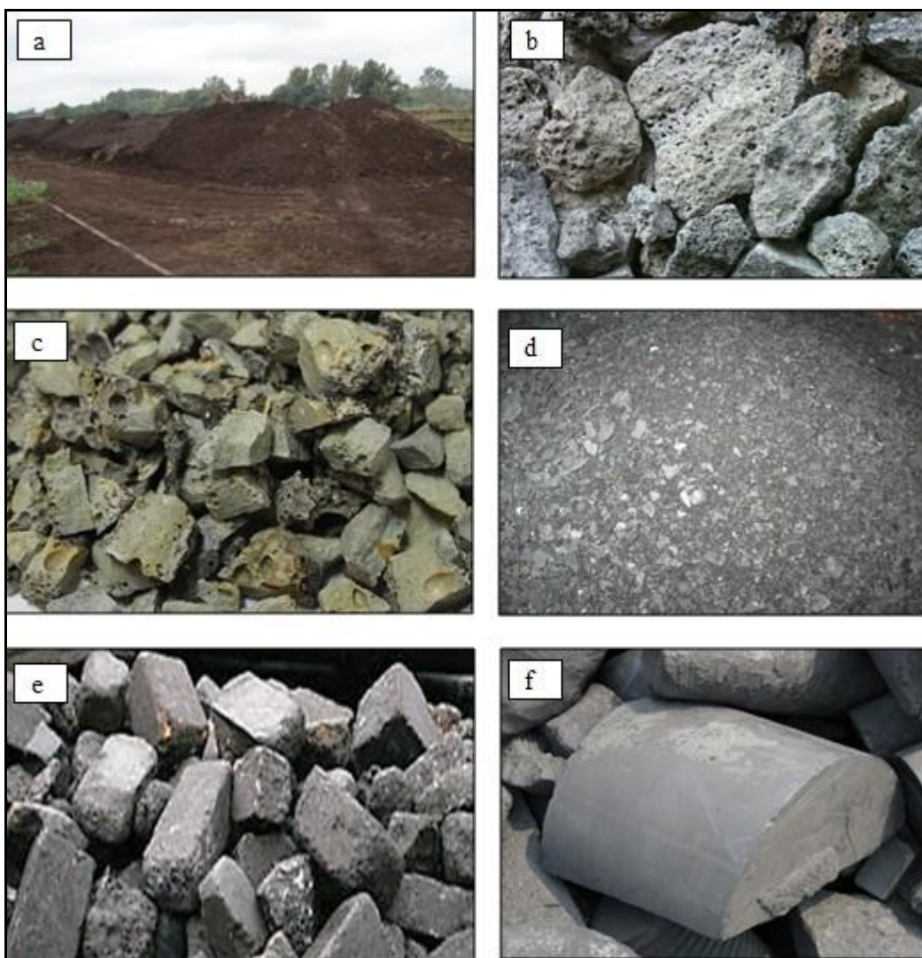
Slika 2. Najčešći proizvodni otpadi iz procesa proizvodnje čelika elektropečnim postupkom [14,16]

Ogorina – nastaje u čeličani tijekom čišćenja odlivenih i ohlađenih čeličnih gredica ili okruglica, slika 2d, a može nastati i pri njihovom zagrijavanju, koje prethodi oblikovanju čelika u proizvode (cijevi, limove i sl.). Sadržaj Fe, oksida Si, Al, Ca i Mg daje ogorini svojstva vrijednog materijala koji se može koristiti u različite svrhe, pa se tako ogorina pokazala dragocjenim materijalom kao dodatak željeznoj rudi u postupku sinteriranja, zatim se koristi u proizvodnji ferolegura, kao dodatak ulošku elektropeći, a može se koristiti u industriji cementa [14].