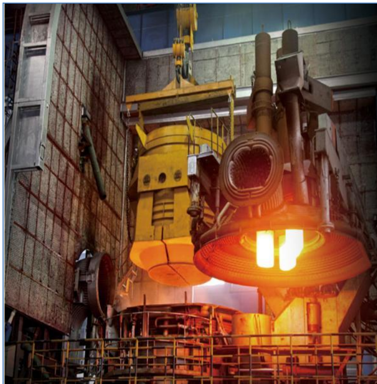
Slika 3. Košara sa čeličnim otpadom iznad otvorene elektrolučne peći [19]

Čistoća otpada utječe na kvalitetu gotovog proizvoda, pa je bitno da otpad ne sadrži veće količine neželjelih i nemetalnih materijala, poput zemlje, gume, plastike, tkanine, drveta i drugih organskih supstanci. Dimenzije otpada su propisane i usklađene s dimenzijama košara za ulaganje i dimenzijama same elektropeći, slika 3. Dijelovi otpada, koji ne zadovoljavaju po dimenzijama, prije ulaganja u peć se usitnjavaju/lome te se prostori na kojima se obavlja ova aktivnost često nazivaju lomara . Prema kvaliteti, čelični otpad se dijeli u 11 kategorija koje se označavaju slovnim i broječanim oznakama [18] kao npr. stari otpad (E3, E1), novi otpad (E2), otpad s nižim sadržajem primjesa (E8, E6), zdrobljeni otpad (E40), čelična strugotina (E5H, E5M), laki legirani otpad s visokim sadržajem primjesa (EHRB), otpad s visokim sadržajem ostataka (EHRM) i zdrobljeni otpad nakon spaljivanja komunalnog otpada (E46) .