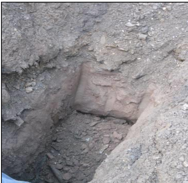
Slika 10. Raskop na području P IV, uzorak br. 7 [22]