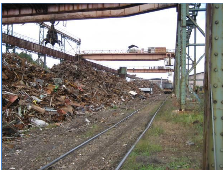
Slika 6. Privremeno odlaganje/skladištenje čeličnog otpada na nezaštićenom tlu [22]