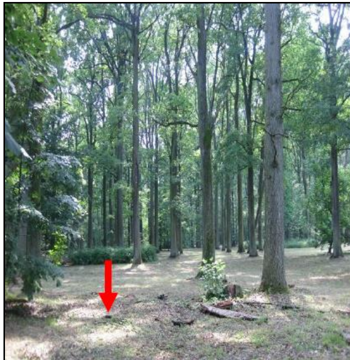
Slika 12. Lokacija uzorkovanja referentnog uzorka tla u parku izvan tvorničkog kruga [22]