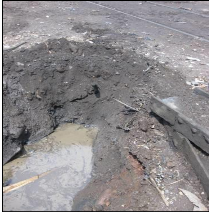
Slika 11. Raskop pun vode području P III, uzorak br. 4 [22]