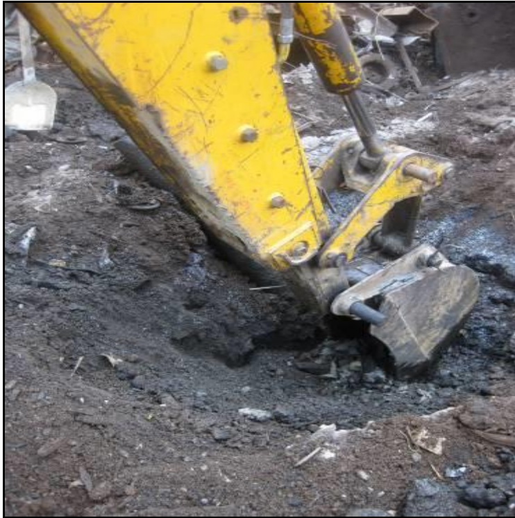
Slika 9. Iskop tla na području lomare [22]