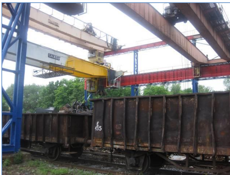
Slika 5. Dovoz čeličnog otpada u željezničkim vagonima [22]

Ispitivanje je provedeno na području tzv. lomare ukupne površine 5300 m 2 . U blizini lomare nema drugih postrojenja koja bi svojom djelatnošću mogla uzrokovati onečišćenje tla, dok je najbliži vodotok rijeka Sava udaljena 1,5 km u smjeru sjeveroistoka. Čelični otpad se u tvornički krug dovezio kamionima ili željezničkim vagonima, slika 5 te se odlagao na nezaštićeno tlo, slika 6.