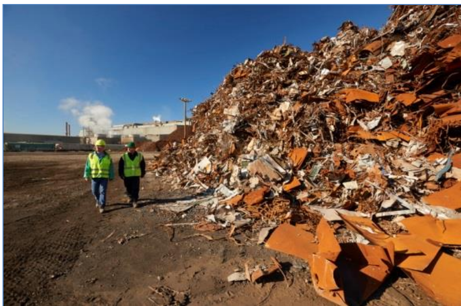
Slika 4. Skladištenje čeličnog otpada na nezaštićenoj zemljanoj površini [20]

To je, naravno, uzrokovalo onečišćenje tla različitim organskim i anorganskim tvarima koje su u otpadu obično sadržane u obliku različitih prahova, nakupina, tekućih fluida i taloga. Ova spoznaja, da do onečišćenja okoliša, a posebice tla, može doći i prije nego što započne proces proizvodnje čelika ulaganjem čeličnog otpada u elektrolučnu peć posebno posljednjih 15-etak godina, zainteresirala je mnoge istraživače [6-11].