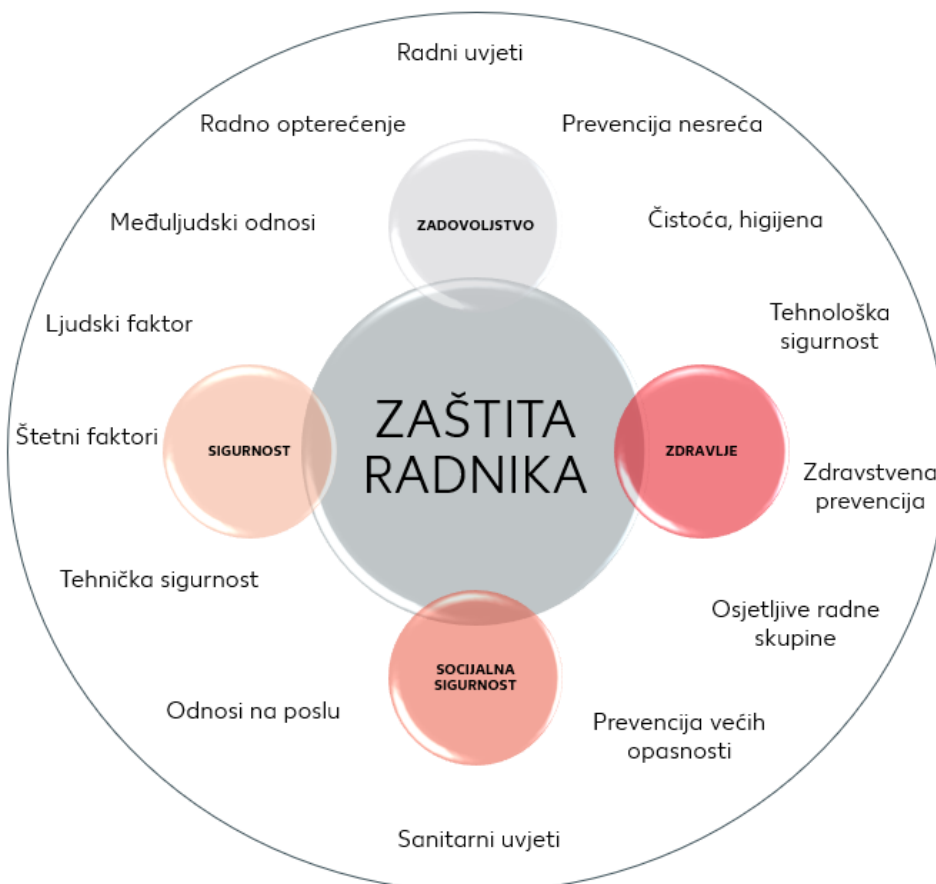
Slika 2. Aspekti rada koji utječu na zaštitu radnika [3]

Važno je da se prilikom procjene rizika u obzir uzmu svi aspekti rada jer na sigurnost i zaštitu zdravlja zaposlenika utječe niz faktora. Sprječavanje nesreće uklanjanjem opasnih tvari i čimbenika, održavanje radne opreme i radnih procesa najčešće je prvo što pomislimo kada kažemo sigurnost i zaštita na radu, no postoji i niz drugih situacija koje dovode do prekomjernog fizičkog i psihičkog opterećenja (slika 2). Ljudski faktor može igrati veliku ulogu u zadovoljstvu i zdravlju radnika. Zbog toga zaštita radnika mora biti usmjerena i na njihovo zadovoljstvo i socijalnu sigurnost [3].