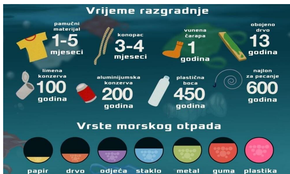
Slika 1. Vrste morskog otpada i vrijeme razgradnje nekih predmeta [6]

Otpad je pronađen u svakom kutku oceana, od najudaljenijih obala, do leda u Arktiku, pa čak i u najdubljim dijelovima morskog dna. Neki od najčešćih i najštetnijih tipova morskog otpada uključuju plastiku, poput opušaka cigareta, plastičnih vrećica i omota hrane, te odbačen ribolovni pribor. Morski otpad također može varirati u veličini, od najmanjih plastičnih komadića, tzv. mikroplastike, koji mogu biti premali da bi se vidjeli golim okom, do ogromnih napuštenih i zastarjelih plovila, građevinskog otpada i kućanskih uređaja koji mogu oštetiti osjetljiva staništa. Iako se neki od ovih predmeta s vremenom mogu razgraditi, drugi su napravljeni da traju dugo (slika 1). Jednom kada se nađu u okolišu, ti predmeti možda nikada u potpunosti ne nestanu [5].