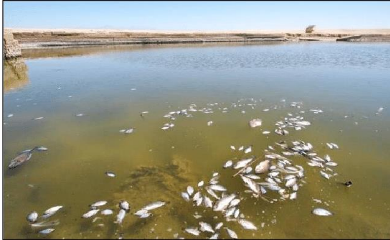
Slika 16. Utjecaj kiselih kiša na ribu [50]