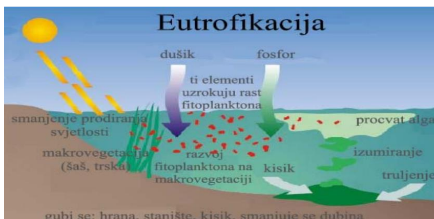
Slika 6. Eutrofikacija [26]

Globalni porast eutrofikacije posljedica je povećanja intenzivne poljoprivrede, industrijskih aktivnosti i ljudske populacije. Eutrofikacija (slika 6) je proces prekomjernog obogaćenja hranjivim tvarima u morskim vodama, a koji potiče pretjerani rast algi. Proces eutrofikacije može posljedično smanjiti sadržaj otopljenog kisika, ugušiti ribe i druge vodene organizme, smanjiti prozirnost vode, smanjiti ukupnu kvalitetu vode i narušiti ekološku ravnotežu. Neke alge čak mogu proizvesti toksine koji su štetni za stoku i ljudsko zdravlje. Mala povećanja algi mogu povećati produktivnost u prehrambenim lancima i održavati više ribe i školjkaša. Međutim, prekomjerno poticanje rasta algi može ozbiljno narušiti kvalitetu vode i ugroziti živi svijet. Kada cvjetanje algi na kraju zamre, mrtve stanice tonu na dno, gdje potiču bakterije na njihovu razgradnju. Proces razgradnje troši otopljeni kisik iz vode. Ako je aeracija vode miješanjem manja od kisika koji se troši bakterijskim metabolizmom, donje vode će postati hipoksične (s niskim sadržajem kisika) ili anoksične (bez kisika), stvarajući stresne ili smrtonosne uvjete za stanovnike dna. Hipoksija je veliki problem u mnogim estuarijima, posebno krajem ljeta i početkom jeseni, i globalno je u porastu [2].