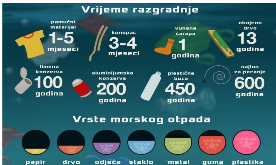
Slika 1. Vrste morskog otpada i vrijeme razgradnje nekih predmeta [6]

Otpad je pronađen u svakom kutku oceana, od najudaljenijih obala, do leda u Arktiku, pa čak i u najdubljim dijelovima morskog dna. Neki od najčešćih i najštetnijih tipova morskog otpada uključuju plastiku, poput opušaka cigareta, plastičnih vrećica i omota hrane, te odbačen ribolovni pribor. Morski otpad također može varirati u veličini, od najmanjih plastičnih komadića, tzv. mikroplastike, koji mogu biti premali da bi se vidjeli golim okom, do ogromnih napuštenih i zastarjelih plovila, građevinskog otpada i kućanskih uređaja koji mogu oštetiti osjetljiva staništa. Iako se neki od ovih predmeta s vremenom mogu razgraditi, drugi su napravljeni da traju dugo (slika 1). Jednom kada se nađu u okolišu, ti predmeti možda nikada u potpunosti ne nestanu [5].