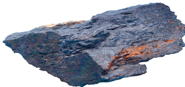
Hematit, Mineraloška zbirka Metalurškoga fakulteta u Sisku

željezo , najrašireniji metal u rudama Zemljine kore, srebrnobijele boje, razmjerno mekan i kovan, te kemijski otporan; kemijski element atomskoga broja 26, gustoće 7,87 \text{ g/cm}^3 , Mohsove tvrdoće 4, tališta 1538 \text{ °C} i vrelišta 2862 \text{ °C} . Željezo vezano u spojevima prisutno je u približno 400 minerala, od kojih su najpoznatiji hematit (udjel željeza do 69,94%), magnetit (do 72,36%), limonit (59,23–65,53%), pirotin i pirit (59,23–65,53%), siderit (do 48,2%). Neizostavno je u proizvodnji različitih slitina velike čvrstoće, tvrdoće, žilavosti, mogućnosti lijevanja i mehaničke obradbe. Najvažniji tehnološki i konstrukcijski materijal današnjice, → ČELIK, slitina je željeza s najviše 2% ugljika.