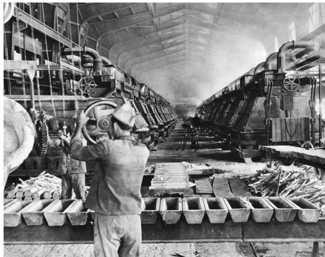
Hala s ćelijama za elektrolizu u Tvornici aluminija Lozovac, 1960-ih

proizvoda u Ražinama izgrađena je 1951–58., poduzeće je osnovano 1952., a od 1953. nosilo je naziv Tvornica lakih metala Boris Kidrič. Proizvodni asortiman tvornice obuhvaćao je aluminijske limove, trake, folije, profile, šipke, cijevi i žicu. Proizvodnja aluminijskih proizvoda započela je 1955 (potkraj 1958. iznosila 12 580 t), elektroliza je u pogon puštena 1958., ali je već 1964. ugašena, kada su tvornice u Lozovcu i Ražinama integrirane u sastav poduzeća → TVORNICA LAKIH METALA (TLM) sa sjedištem u Šibeniku. Zbog problema s ekonomičnosti poslovanja, proizvodnja glinice obustavljena je 1971., a elektroliza 1991., dok je 1976–87. izgrađeno postrojenje za preradbu sekundarnog (recikliranog) aluminija kapaciteta 15 000 t na godinu, a 1985. ustrojeno je postrojenje za proizvodnju aluminijskih odljevaka (tlačni lijev). Prije Domovinskoga rata TLM je pokrивao više od 90% aluminijske proizvodnje u Hrvatskoj. Od 2016. poduzeće posluje pod nazivom Impol-TLM.