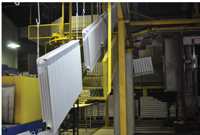
Aluminijski radijatori spremni za pakiranje, tvornica Lipovica