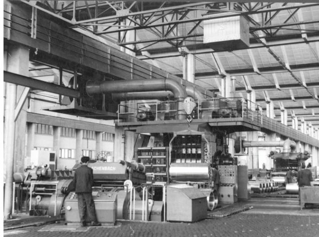
Lijevanje trupaca u ljevaonici, Tvornica lakih metala Boris Kidrič, Šibenik, druga polovica XX. st.