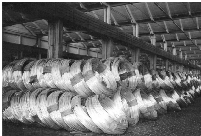
Aluminijska žica, Tvornica lakih metala Boris Kidrič, Šibenik

Osim u Šibeniku, ustrojena je i proizvodnja aluminijskih proizvoda i u drugim krajevima Hrvatske. U Zagrebu je 1922. osnovano poduzeće → TVORNICA OLOVNIH I ALUMINIJSKIH PROIZVODA (sv. 1) koje je isprva proizvodilo olovne i kositrene cijevi, olovni lim i plombe, a aluminijski valjani lim počelo je proizvoditi 1930-ih, te je ubrzo potom izgrađeno i postrojenje za manju valjaonicu. Znatnija proizvodnja ostvarena je u području primjene aluminija u graditeljstvu. Tijekom 1960-ih ustrojeno je poduzeće aluminijskih konstrukcija Elemes iz pogona TLM-a, te poduzeće Palk u Kistanjama. Godine 1977. u rad je puštena tvornica za oplemenjivanje aluminijskih traka Omial u Omišu, koja je proizvodila formate namijenjene prehrambenoj industriji, profilirane obloge u