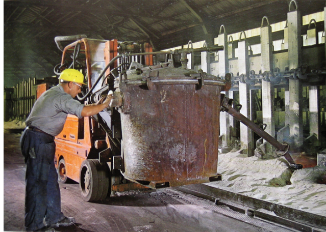
Probijanje elektrolitičke kore i sakupljanje aluminija u vakuumski lonac u proizvodnom pogonu Ražine, Tvornica lakih metala Boris Kidrič, Šibenik

Aluminij i njegove slitine rabe se sve više zbog dobrih mehaničkih, kemijskih i električnih svojstava, male specifične težine i lijepog izgleda. Rabe se u gradnji zrakoplova, brodova, vozila, strojeva, motora, u elektrotehnici, u kemijskoj industriji, kućanstvu, u građevinarstvu, arhitekturi, za izradbu ukrasnih predmeta i dr. Najvažnije su aluminijske slitine poboljšanih svojstava duraluminij, silumin, magnalij i aluminijska bronca. Sadržavaju najmanje 50% aluminija uz različite teške ili lake metale, poput → BAKRA, mangana, silicija, nikla, magnezija i dr. Ovisno o legirnim elementima, posjeduju otpornost prema koroziji i kemijskim utjecajima, sposobnost oblikovanja i lijevanja, mogućnost povećanja čvrstoće, tvrdoće i žilavosti, sposobnost primanja velikog sjaja poliranjem i dr. Spojevi aluminija također nalaze važnu primjenu u gospodarstvu. Ističu se sulfati – Al_2(SO_3)_2 , alauni (stipsa), aluminijev acetat i dr.