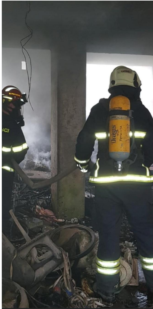
Slika 5. Unutarnja navala [7]