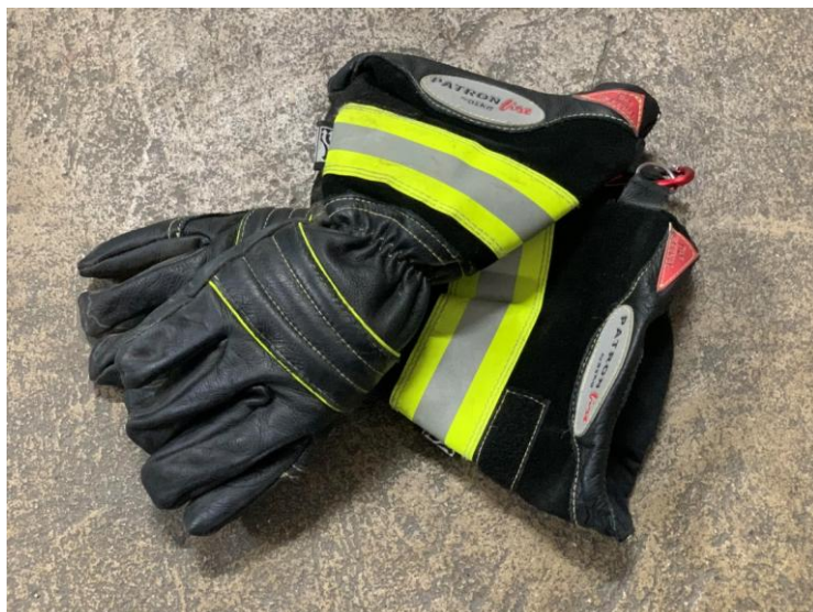
Slika 11. Zaštitne rukavice za vatrogasce [7]