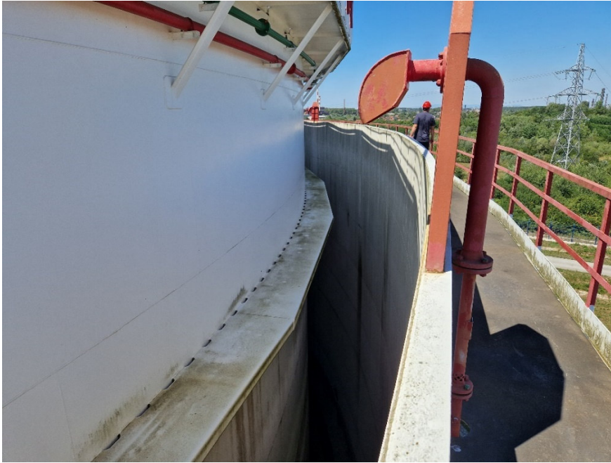
Slika 4. Prikaz spremnika s prstenastim prostorom oko spremnika