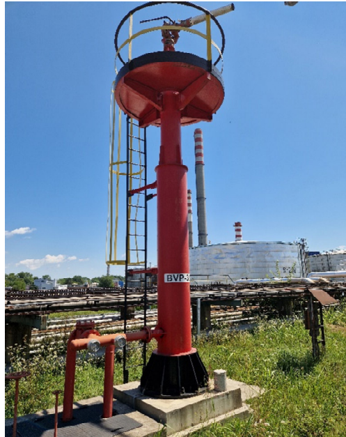
Slika 19. Stabilni bacač vode i pjene

Osim zračnih komora koje se nalaze na samim spremnicima, tankvane i spremnike možemo još štititi i pomoću bacača vode i pjene. Bacači i mlaznice za pjenu su uređaji koji nam pomažu da pjenu proizvedemo, usmjerujemo i izbacujemo na požar. Oni mogu biti stabilni ili mobilni. [18]