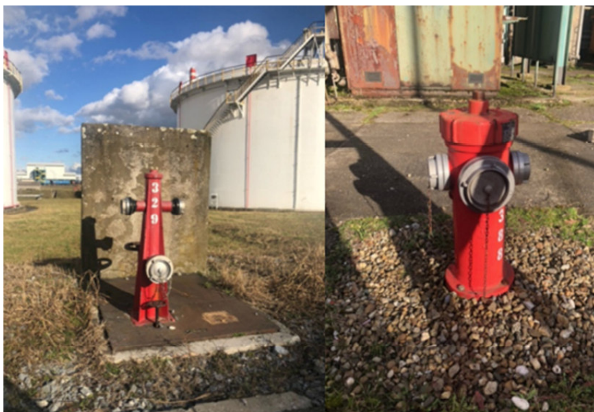
Slika 15. Nadzemni hidranti Tip RNS (lijevo) i Silvani (desno)

Takvi cjevovodi se nalaze na lako pristupačnim prometnicama blizu kojih se nalaze i hidrantski nastavci (slika 15.) na koje se priključuju vatrogasni kamioni jer omjer miješanja je s velikim udjelom vode (1%, 3% ili 6% pjenila i 94% do 99% vode). Vatrogasni kamioni na lokaciji RNS imaju spremnike pjenila od 5 000 litara te je potreban stalni dotok vode kako bi se mogla raditi mješavina i slati prema zapaljenom spremniku.