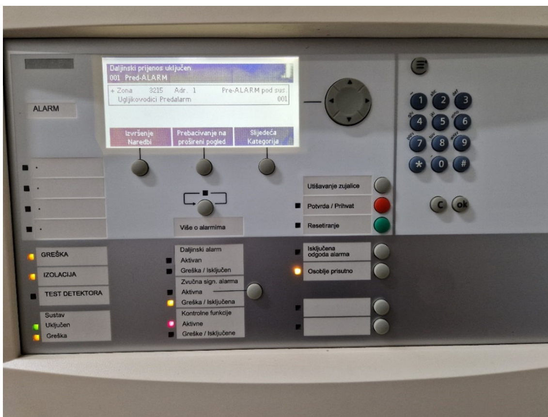
Slika 7. Digitalna nadogradnja javljača požara sa sustavima pre-alarma