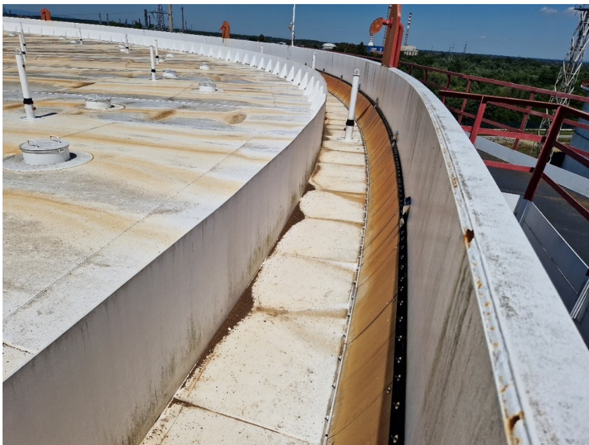
Slika 2. Prikaz spremnika s plivajućim krovom