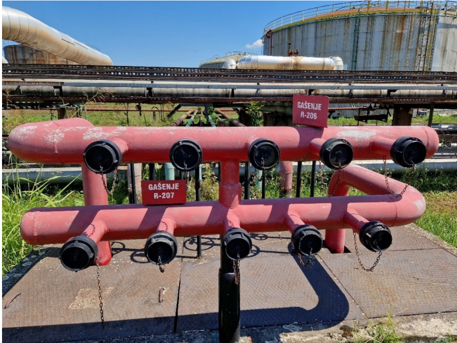
Slika 14. Priklučci polu-stabilnog sustava u RNS

Polu-stabilni sustavi gašenja (slika 14.) od stabilnih se razlikuju po tome što oni nemaju vlastiti izvor sredstava za gašenje čvrsto spojen cjevovodom već se na njih spaja mobilni izvor gašenja poput vatrogasnih kamiona koji zatim svojom vatrogasnom pumpom u sustav upumpavaju gotovu mješavinu sredstava za gašenje.