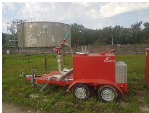
Slika 20. Mobilni bacač vode i pjene

Stabilni bacač na slici 19. se nalazi na lokaciji RNS i ima direktni fiksni priključak na hidrantsku mrežu kada nam je potreban kao bacač vode ili se možemo na njega spojiti pomoću vatrogasnog vozila kada nam je potreban kao bacač pjene. Domet ovog bacača je 60 metara za vodu i 55 metara za pjenu pri tlaku od 10 bara.