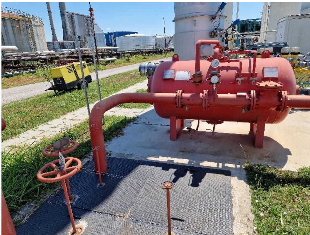
Slika 12. Tlačni dozator pjene na lokaciji