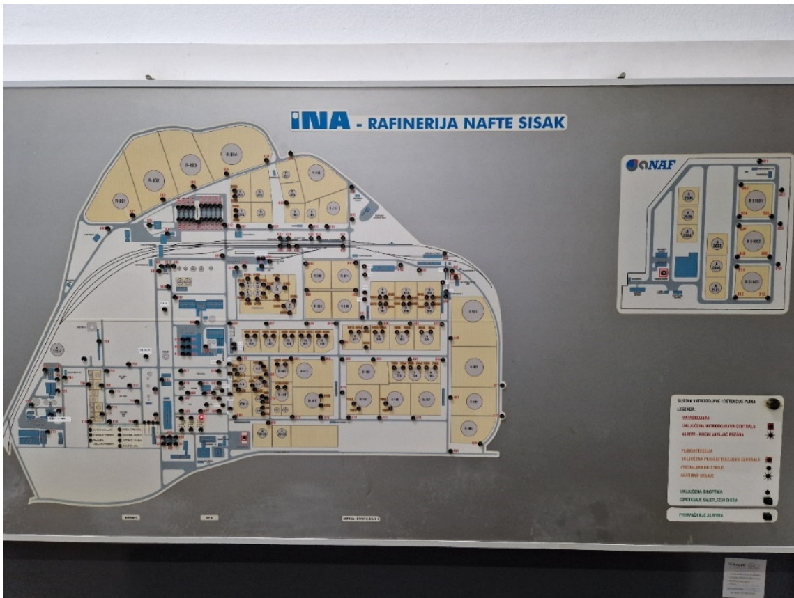
Slika 5. Sustav dojave - svako crveno LED svjetlo označava ručni javljač

U RNS se koriste na svim lokacijama ručni javljači požara koji su označeni brojevima i nalaze se raspoređeni po prometnicama, postrojenjima i pumpanicama na spremničkom prostoru spojeni na vatrogasnu dojavnu centralu u vatrogasnim spremištima (slika 5.). Na ekranu vatrodojavne centrale se prikazuje broj ručnog javljača s nazivom koji daje njegovu lokaciju. Osim ručnih javljača koriste se i telefonske linije prema Vatrogasnoj službi RNS s brojevima telefona 11-11 i 20-11 koji se nalaze u svima kabinama postrojenja, te radio stanica kojom su opremljeni vanjski operateri na postrojenjima i spremničkom prostoru.