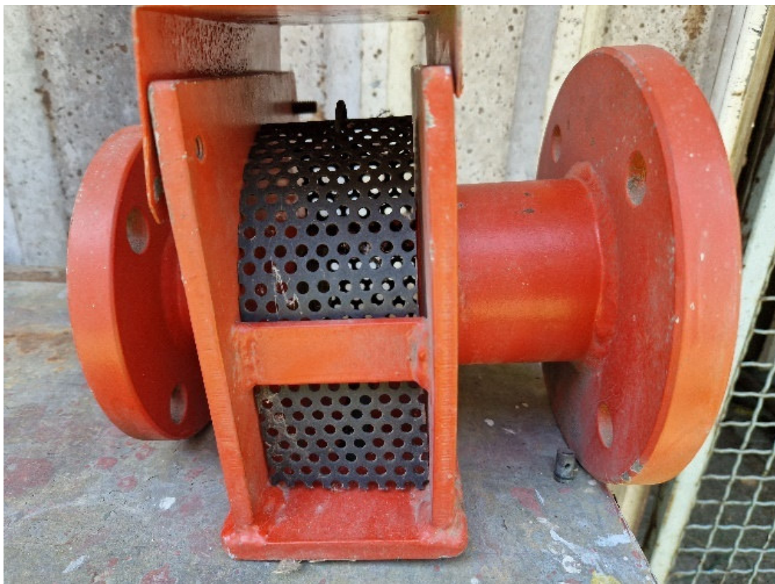
Slika 16. Prikaz zračne komore s mrežicom

Nakon prolaska kroz cjevovod mješavina dolazi do zračnih komora čija je svrha da se u mješavinu dodaje zrak i tako proizvede mehanička pjena koja će nam pomoći da ugasimo požar na spremniku. Zračne komore za spremnike sa čvrstim krovom se razlikuju od onih za spremnike s plivajućim krovom. Na slici 16. vidimo jednu vrstu zračne komore koja se postavlja na spremnike sa čvrstim krovom. Takva zračna komora se sastoji od priрубnica različite veličine, jedne manje kroz koju dolazi mješavina i jedne veće kroz koju prolazi pjena koja zbog većeg volumena zahtijeva i veći promjer. Sama mješavina prolazi kroz sapnicu koja smanjuje promjer i daje brzinu mješavini i tada radi podtlaka koji se stvara prilikom prolaska kroz mrežicu koju vidimo na slici 17. dolazi do opjenjenja. Nasuprot sapnice se nalazi zaštitno staklo koje će tlak i brzina pjene razbiti kod uključivanja u pogon. Staklo se postavlja iz sigurnosnih razloga zato što bi se moglo dogoditi da se zapaljive pare i plinovi bez tog stakla kao prepreke kroz sustav cjevovoda spuste do razine prometnice na polu-stabilnom sustavu.