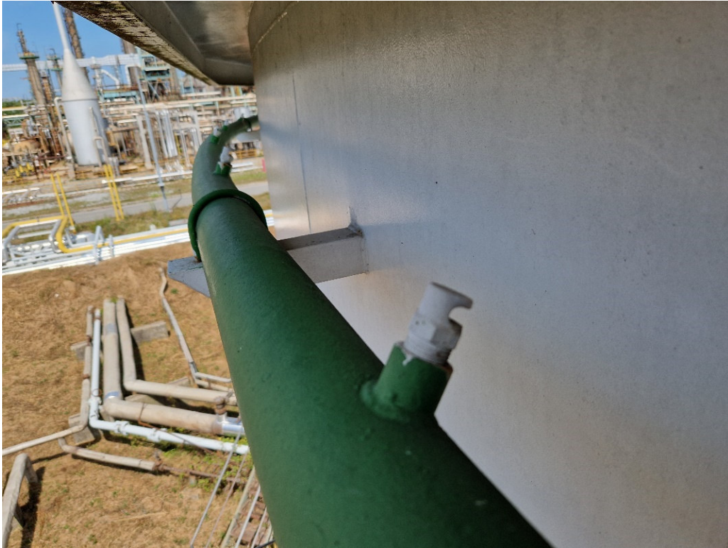
Slika 11. Mlaznica za hlađenje plašta spremnika

Kod stabilnih sustava gašenja spremnika koriste se specijalni uređaji koji doziraju vodu i pjenilo u određenom postotku kako bi se dobila mješavina i nazivaju se mješači ili dozatori. Prema načinu rada i konstruktivnoj izvedbi dijele se na [17]: