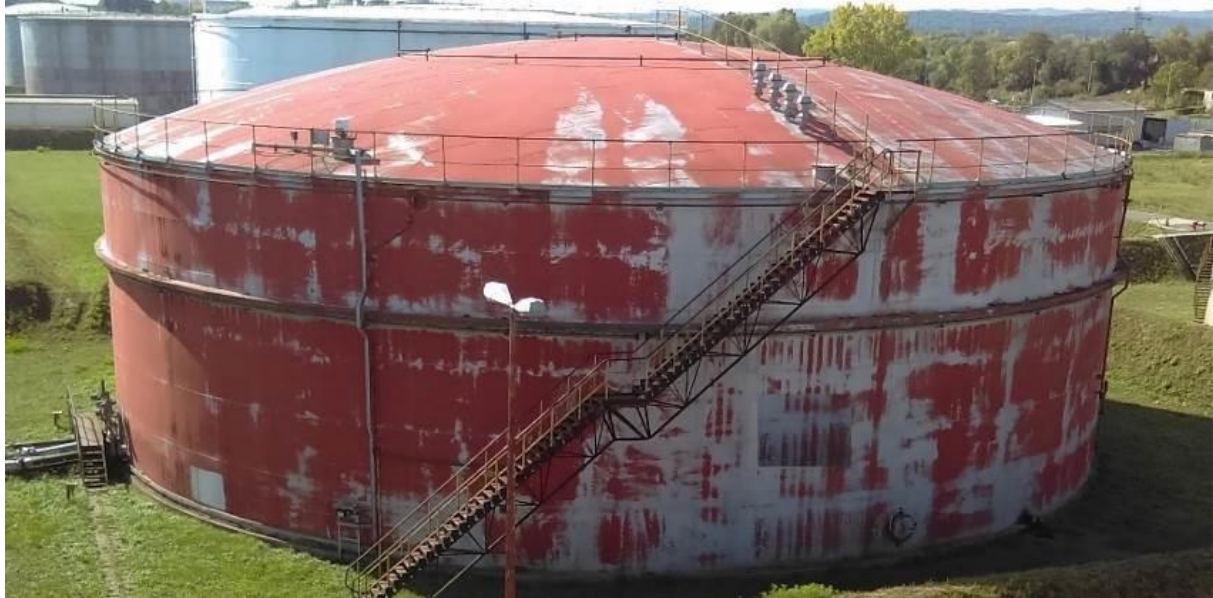
Slika 1. Prikaz spremnika sa čvrstim krovom

Spremnici s čvrstim krovom (slika 1.) su spremnici koji u sebi od površine tekućine do vrha krova imaju plinsku zonu i zato se takvi spremnici grade i s oslabljenim vezama između krova i plašta tako da ako dođe do eksplozije samo krov takvog spremnika bude odbačen dok će plašt i dalje zadržavati tekućinu. Oni dolaze s određenom opremom kao što je prikazano na slici 1.