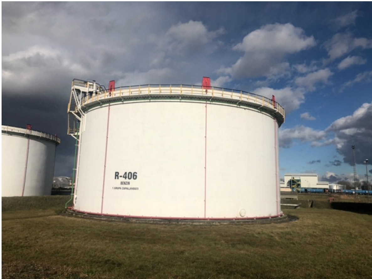
Slika 3. Prikaz sabirnog prostora spremnika zemljanim nasipima

Drugi tip tankvane je onaj koji tvori prstenasti prostor (ili prstenasti plašt) (slika 4.) koji prema Pravilniku mora iznositi minimalno 4/5 visine glavnog plašta spremnika, mora imati vlastitu stabilnu instalaciju za hlađenje i gašenje [9]. Prednost ovakvih tankvana je u tome što se one vrlo lako zapune pjenom za gašenje jer širina površine za gašenje je manja (2-3 metra iznosi prostor između glavnog plašta i prstenastog plašta) i lakše je dobiti na visini nanošenja pjene na zapaljivu tekućinu te time vrlo brzo zatvoriti zapaljive pare ispod pjene i spriječiti nastajanje požara ili njegovo širenje. Nedostatak je što su potrebne dvije odvojene instalacije za hlađenje plašta spremnika i dva odvojena sustava gašenja prostora spremnika – jedan za sami prsten odnosno unutrašnjost spremnika, a drugi za gašenje prostora prstenastog prostora. To povećava financijske izdatke kod izgradnje, održavanja i treniranja osoblja.