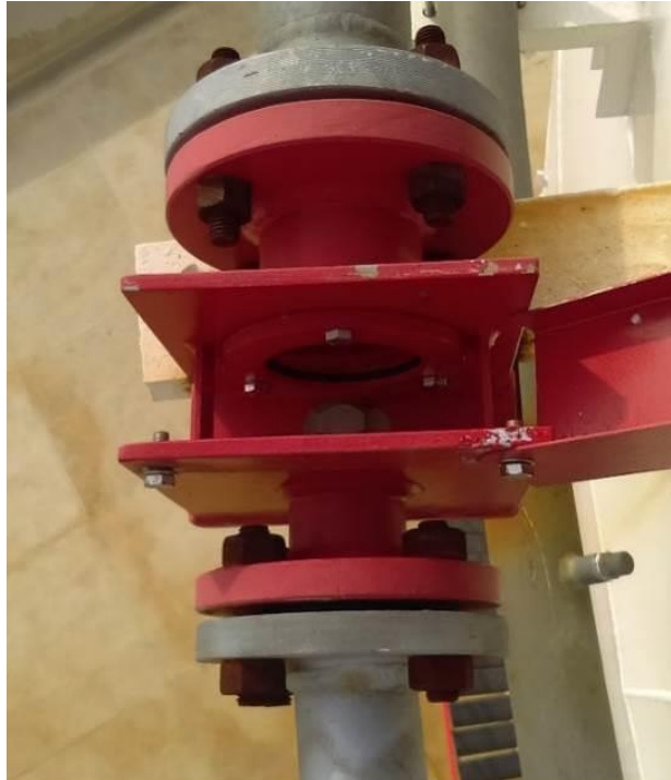
Slika 17. Prikaz jedne vrste zračnih komora za čvrste spremnike

Druga vrsta zračnih komora su one koje koristimo na spremnicima s plivajućim krovom koji nemaju sapnice, staklo i mrežicu nego rade na principu udara mješavine u izlaz mlaznice koji je zakrenut za 90^\circ te se na takav mehanički način proizvodi opjenjenje. Takve zračne komore se postavljaju na vrhu spremnika uz sam rub. Nakon udara u zračnu komoru se slijevaju uz unutarnju stranu plašta spremnika te gase prostor između plivajućeg krova i plašta spremnika.