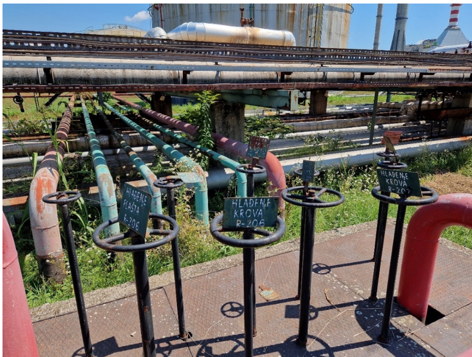
Slika 10. Prikaz ručnog uključivanja hlađenja spremnika

Puštanje u rad sustava za hlađenje i gašenje obavlja se pomoću okna koje sadrži ventile koji se pojedinačno otvaraju za potrebe hlađenja plašta spremnika ili krova spremnika i gašenja s tlačnim dozatorima pjene.