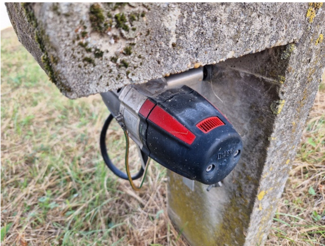
Slika 6. Detektor plina Dräger u tankvani